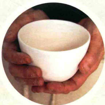
拉坯成型、刷上白色泥浆的杯坯