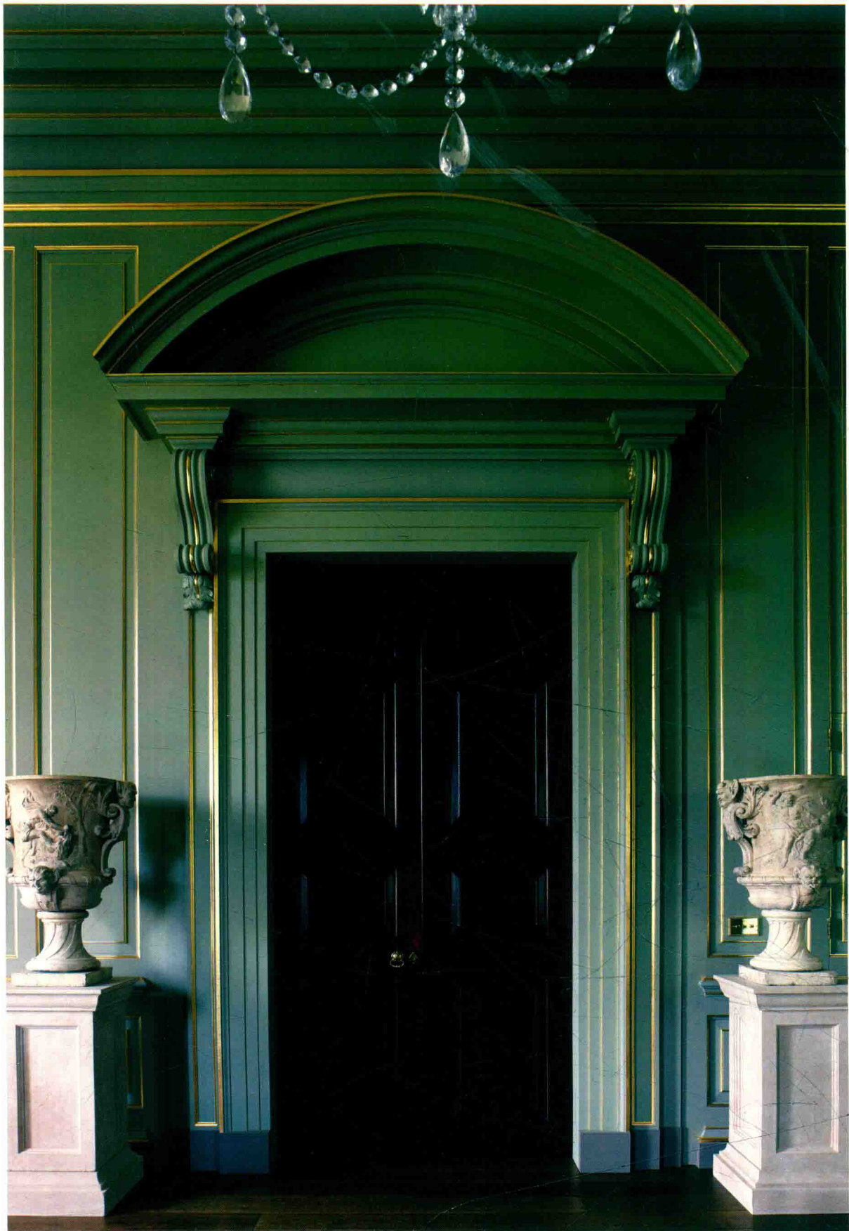
佛恩庄园，餐厅正门