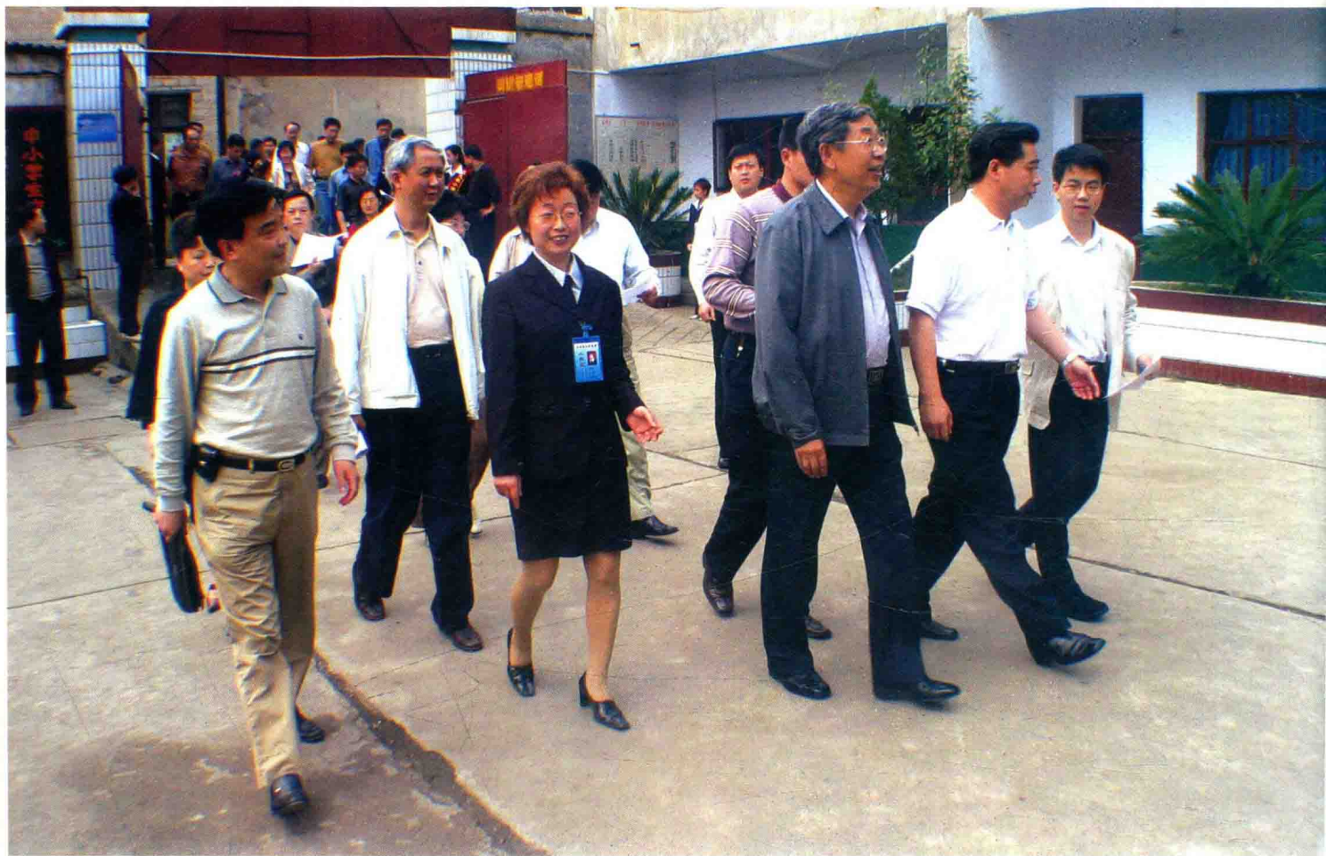
全国人大常委会副委员长许嘉璐视察南明区义务教育工作