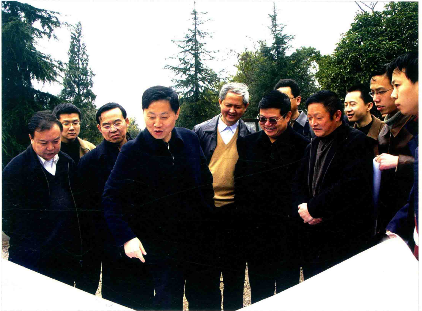
贵阳市委副书记、市长袁周在南明区视察