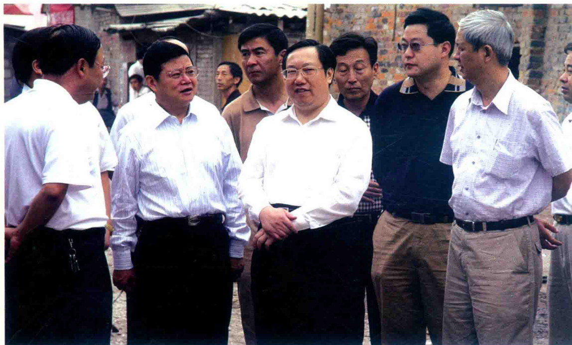
省委常委、贵阳市委书记王晓东视察南明区玉溪路改造工程