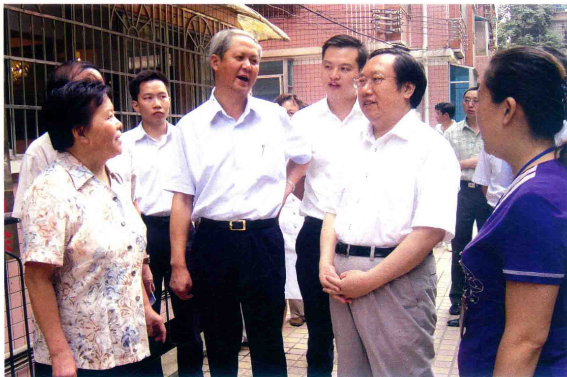
省委常委、贵阳市委书记王晓东在河滨办事处金地社区了解社区建设情况