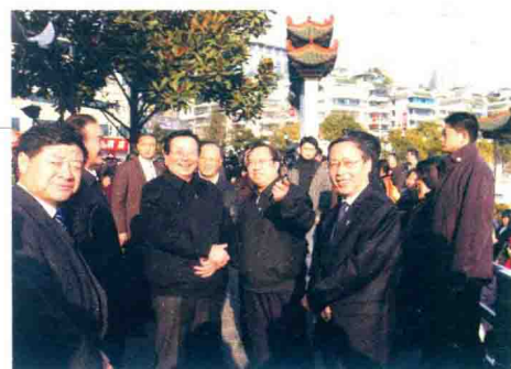
2007年1月28日,曾庆红副主席在贵阳市考察南明河治理工程