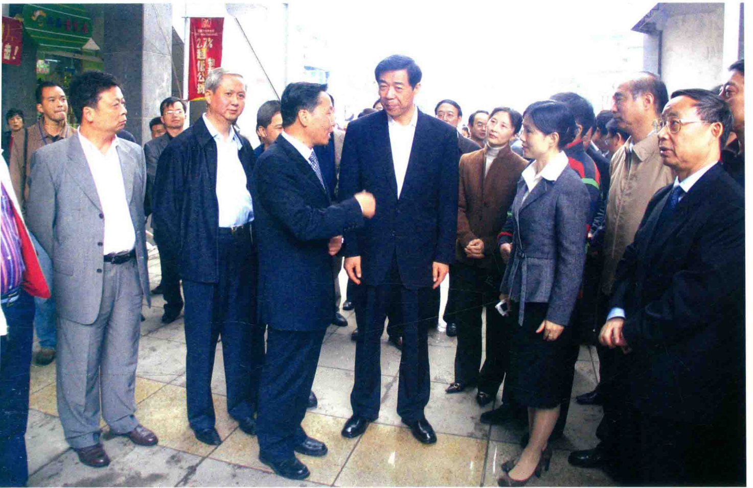
商务部部长薄熙来视察南明区白马井商业社区