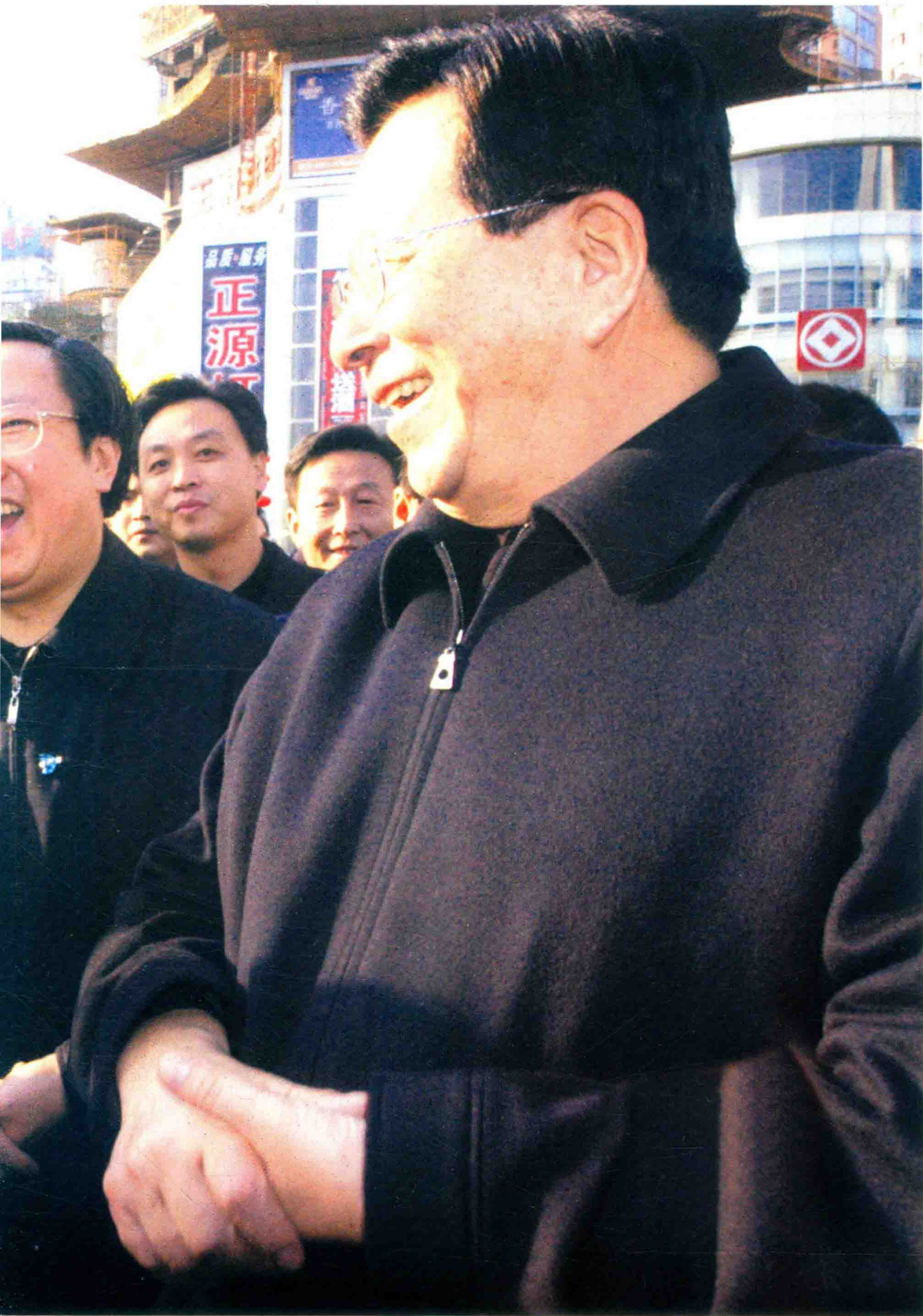
2007年1月28日，曾庆红副主席在贵阳市考察南明河治理工程时与贵阳市民亲切交谈