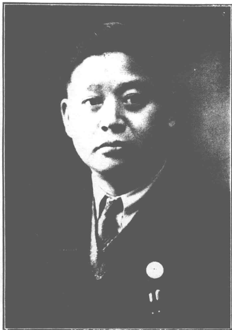
鑄 鴻 邵 長 局 政 財