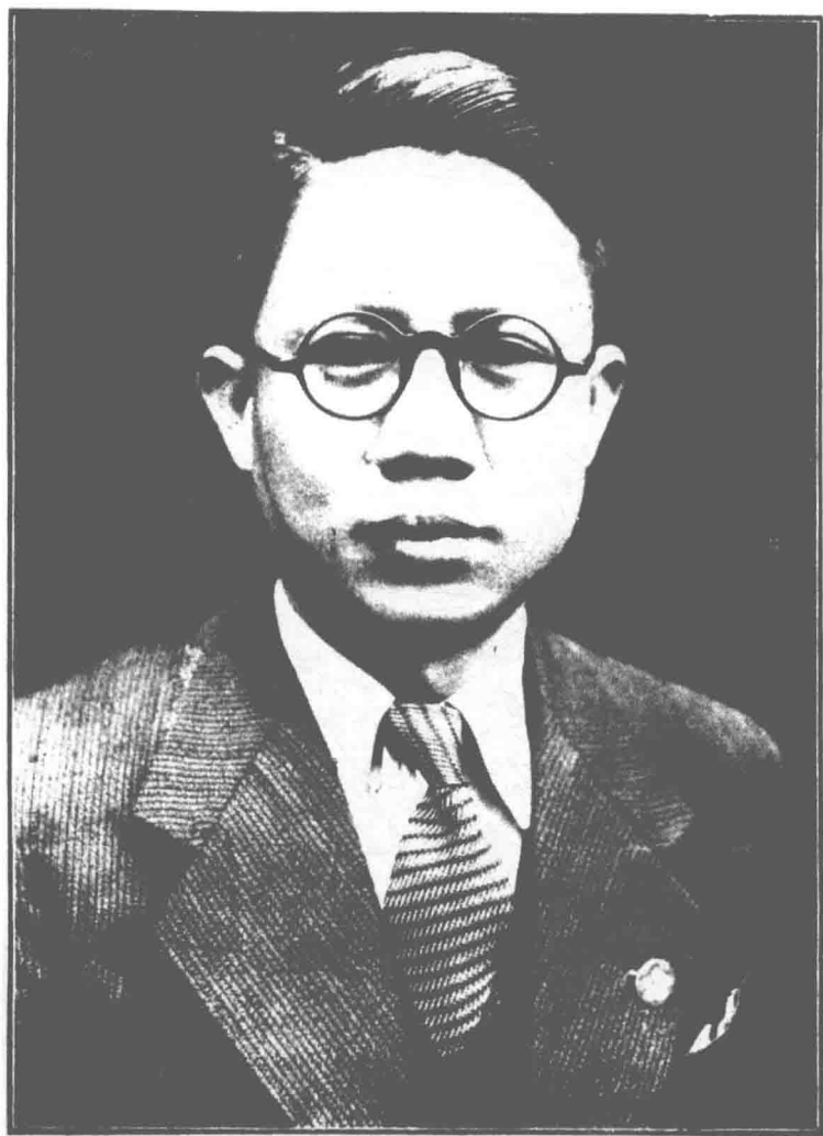
震 黃 事 參