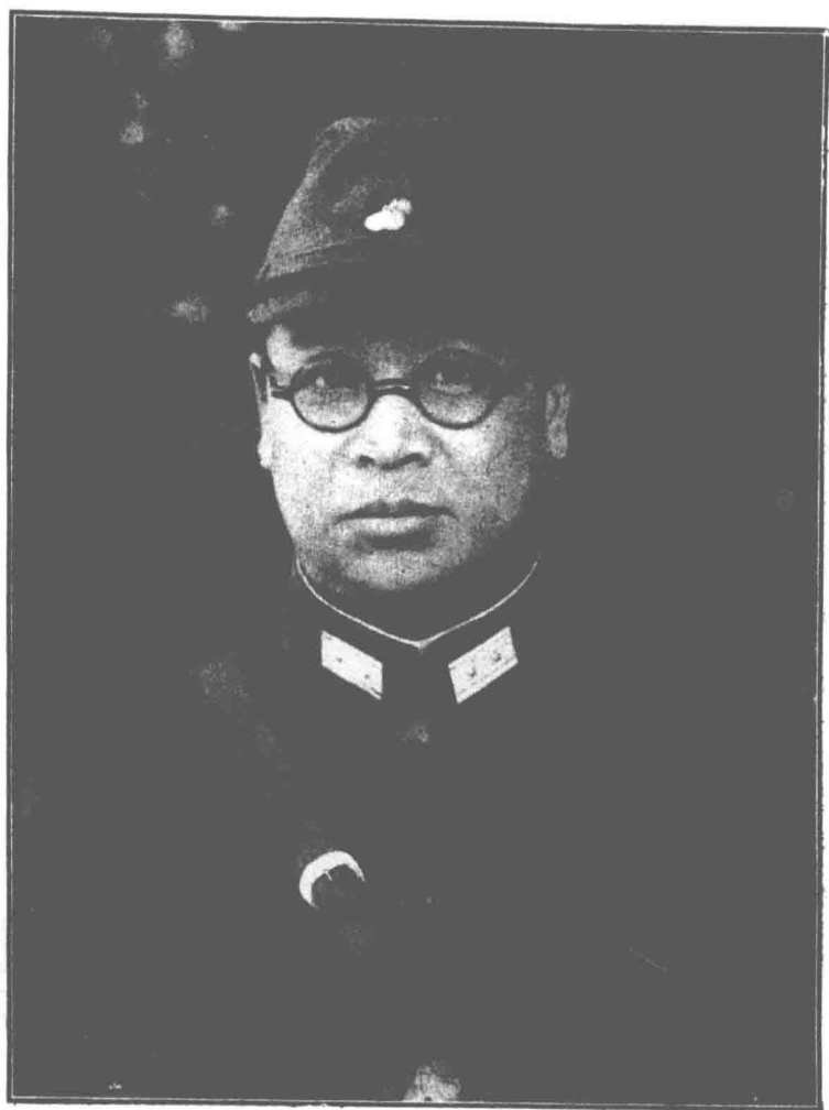
道 援 任 辦 督 任 前