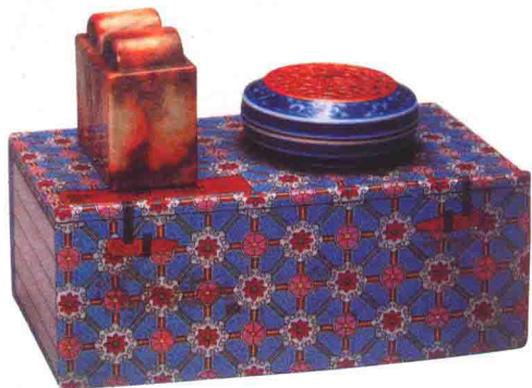
清乾隆款粉彩书式盒