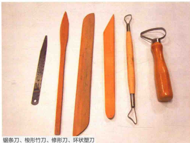
锯条刀、梭形竹刀、修形刀、环状塑刀