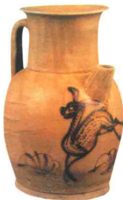
唐长沙窑青釉执壶