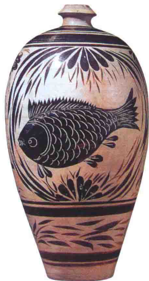
宋磁州窑白地黑花梅瓶