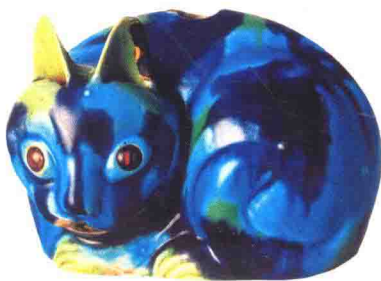
清康熙珐花釉猫式香熏