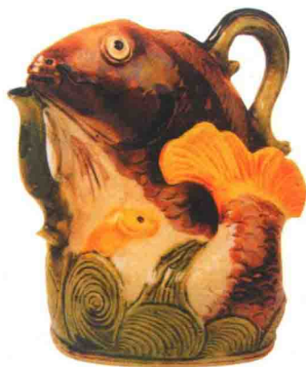
清康熙素三彩水壶