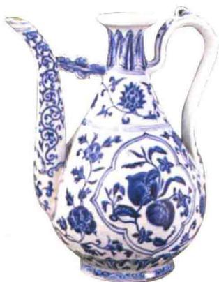
明宣德青花三果纹执壶

新石器时代同心圆及水波纹彩陶盆，让我们不得不惊叹于几千年前先民们的高超技艺以及源于生活的对美的生动表现；唐代长沙窑的青釉执壶，让我们感受到了独特的瓷器釉下彩绘的装饰美；宋代磁州窑白地黑花梅瓶，散发着民窑粗犷豪放、雄健浑厚的艺术气息；明代宣德青花三果纹执壶，以其古朴、典雅的造型，晶莹艳丽的釉色，多姿多彩的纹饰打动着我们，其精湛的青花烧制技术为后人所称颂；清康熙素三彩水壶、清乾隆款粉彩书式盒、清康熙珐花釉猫式香熏都让我们感叹：生活也能拥有如此的情调与韵味，生活也可以如此浪漫而优雅！