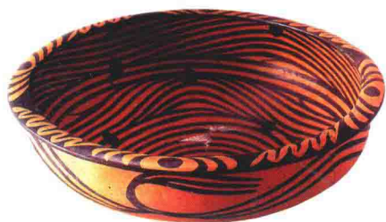
新石器时代同心圆及水波纹彩陶盆

陶艺从远古走来，带着实用与美，一直伴随在我们身边。拿起旷远的泥土，释放你的自由情感，让我们一起开始体验陶艺的乐趣吧！