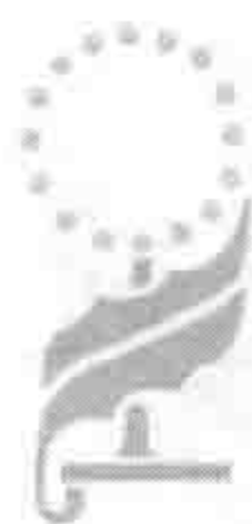
海尔布隆市政委员