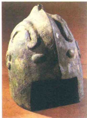
图 1 青铜盔

根据考古研究，中国最早的甲冑出现在商朝，即公元前 17 世纪至公元前 11 世纪左右。但是因年代久远，士兵所穿戴的铠甲、冑甲形式较难考究。此时青铜冶炼技术已经十分成熟，图 1 是在江西出土的盔甲，为青铜所造，可见当时已经用青铜为材料制作防身的铠甲。