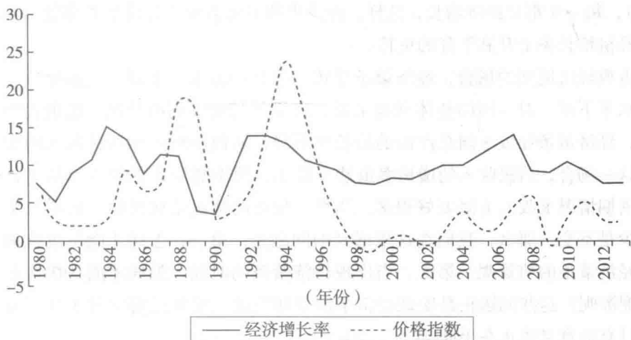
图 1-2 我国改革开放以后的宏观经济波动

高的年份是 1984 年，达到 15.2%，经济增长率最低的年份是 1990 年，为 3.8%。不仅如此，经济增长的波动不再表现为正增长和负增长的交替，而仅仅表现为增长率高低的交替。与经济增长率较为稳定的表现相反，改革开放以后，和计划经济时期相比，价格波动的幅度大大提高。在 20 世纪 80 年代和 20 世纪 90 年代大部分时期，频繁爆发通货膨胀（即物价上涨），对宏观经济造成严重干扰。通过市场化改革的深入，2000 年以后，价格波动的幅度大为下降，表现出较好的稳定性。