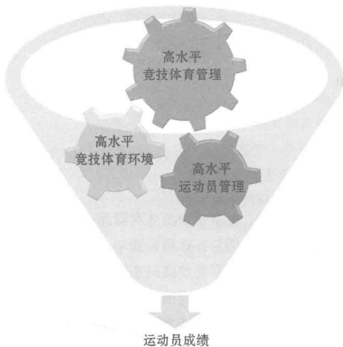
图 A 高水平竞技体育管理漏斗图