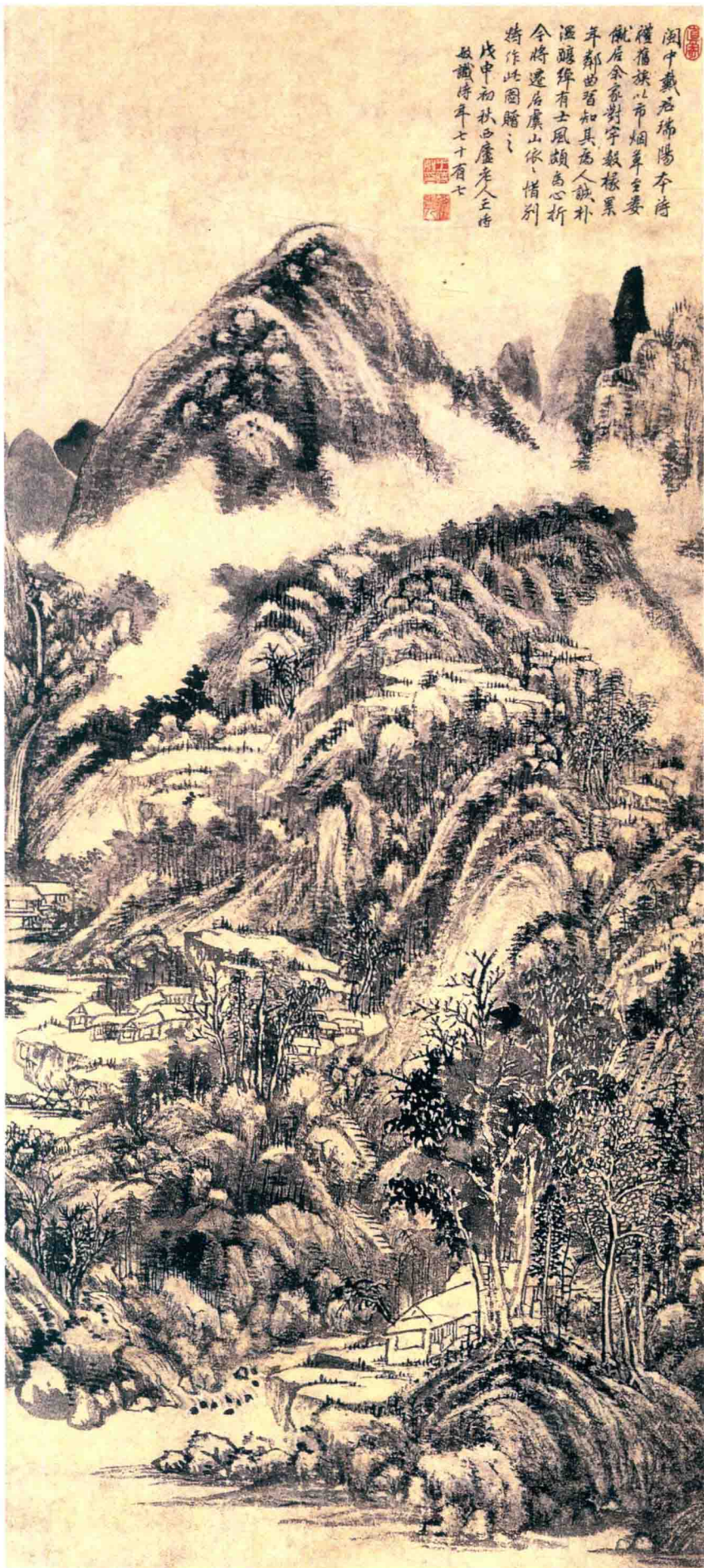
王时敏 虞山惜别图轴 清 纸本墨笔 纵134厘米 横60.2厘米 故宫博物院藏