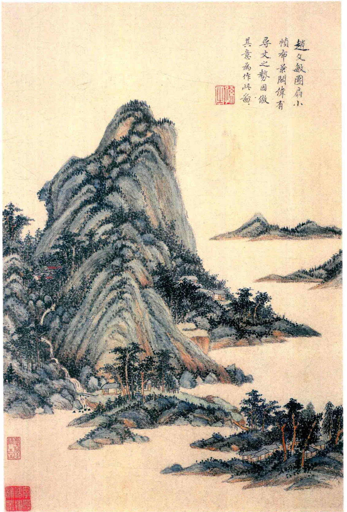
王时敏 仿古山水图册（之二） 清 纸本设色 纵44.5厘米 横29.7厘米 故宫博物院藏