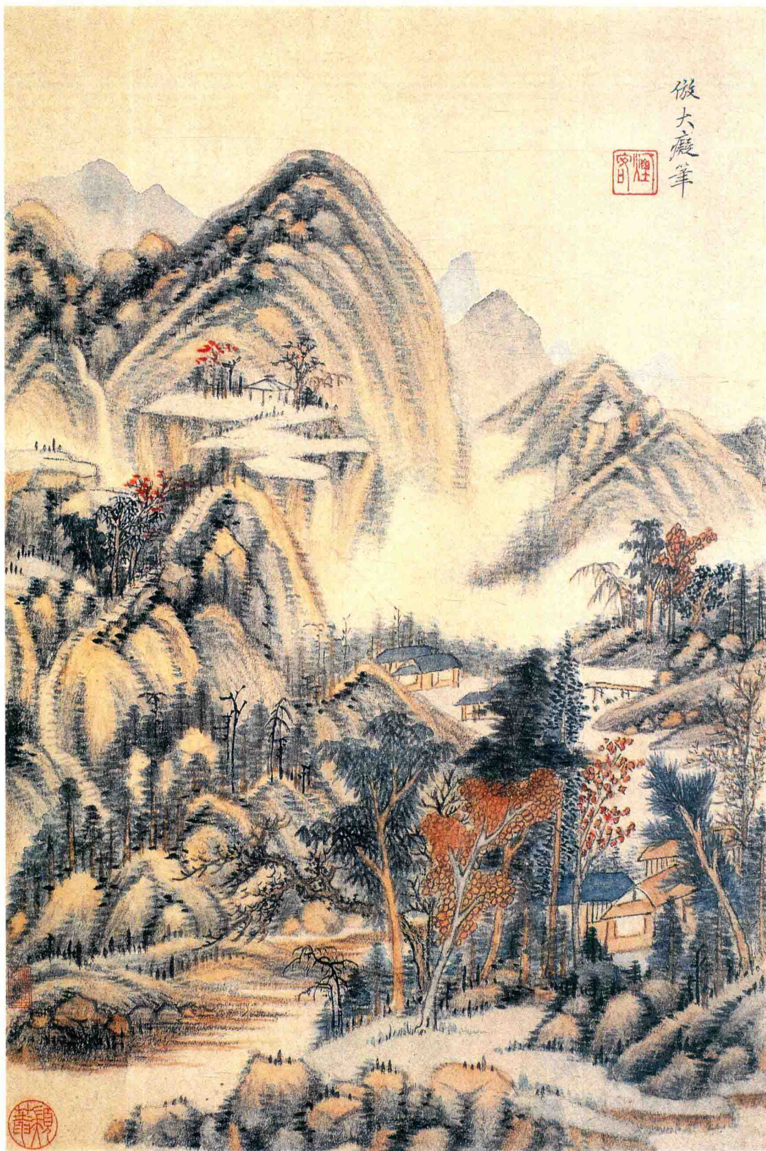
王时敏 仿古山水图册（之一） 清 纸本设色 纵44.5厘米 横29.7厘米 故宫博物院藏