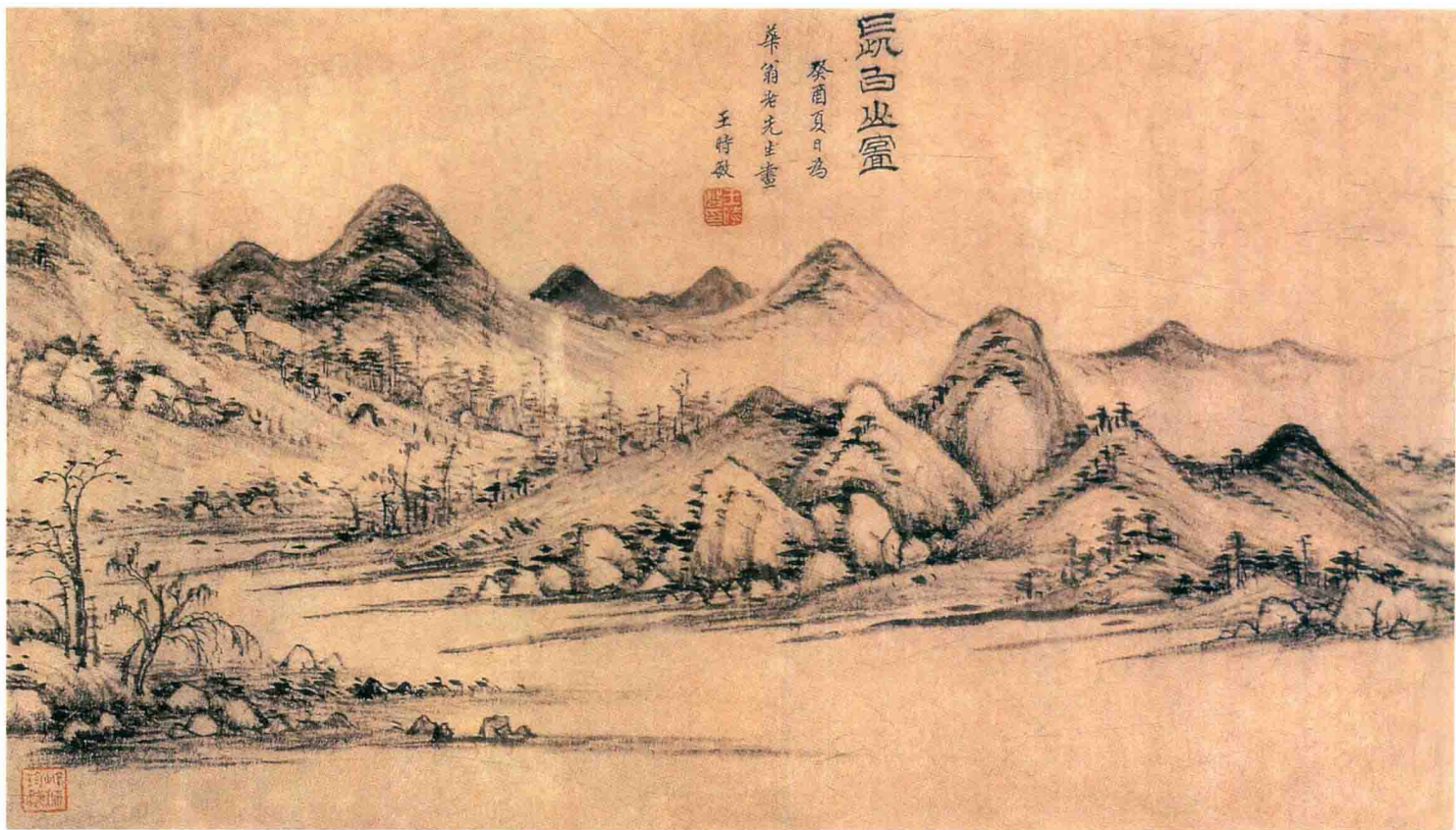
王时敏 长白山图卷 清 纸本墨笔 纵31.5厘米 横201厘米 故宫博物院藏

王时敏的长卷山水画较为少见,《长白山图》卷系作者四十二岁时所绘山水长卷。图绘重山复水,此起彼伏,连绵不断。山间有茂林烟树,飞瀑流泉。山脚平溪小桥,全无人迹,数座房舍隐现于丛林之中。用笔圆润,墨色清淡秀雅,意境疏简幽静。画风略有董其昌的笔韵,但更多则是自家用笔古秀、布置深远的风格。