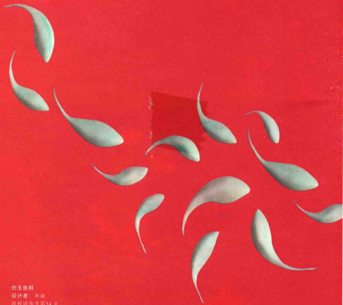
仿玉鱼群 设计者：寒福 教程请参考第34页。