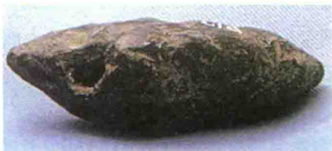
图1-4 陕西西安半坡村遗址出土的一音孔陶埙