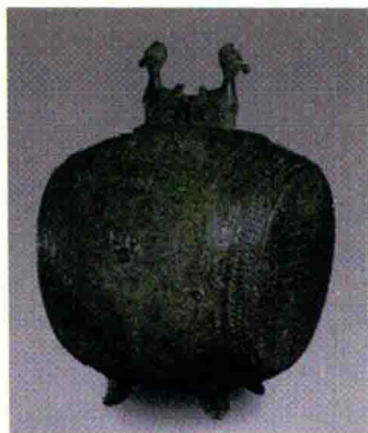
图1-11 河南安阳商代双鸟饕餮纹铜鼓

此外，在商代出现了制造水平较高的铜鼓，从现收藏于日本京都的双鸟铜鼓，依稀可见商代鼓乐器的脉络（见图1-11）。铜鼓通高79.4厘米，全身布满清晰精美的纹饰，鼓面制作成像鼉皮那样的鳞状，在鼓的边缘部位装饰有三排乳钉纹，用钉子把鼓皮绷得紧紧的，形似真鼓。鼓身有神人面部图案，鼓背上有一对鸟装饰其上，在鼓身的下部饰有4只小足，鼓的顶部饰有饕餮纹，因此被称为神人纹（饕餮纹）双鸟铜鼓。