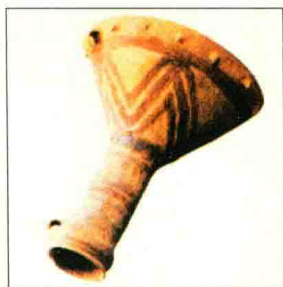
图1-9 甘肃永登乐山坪出土的陶鼓

木鼓多因材料易朽，很难见到实物。1980年山西省襄汾县陶寺夏文化遗址出土了一件鼉鼓（所谓鼉鼓，是指用鳄鱼皮蒙制而成的鼓），木制（见图1-10）。其鼓腔用树干挖成，高约100厘米，上宽43厘米，下宽57厘米，出土时鼓腔已残。该鼉鼓距今4400余年，为夏代遗物。