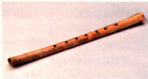
图1-1 河南舞阳贾湖遗址出土的新石器时代骨笛

考古音乐者分别于1986年、1987年和2001年先后3次在河南省舞阳县贾湖新石器时代遗址中发掘出一批用鹤类尺骨制作而成的骨笛，共30余支（见图1-1）。其中，被河南博物院收藏保存最完整的一支制作精美，全长23.6厘米，体为细长管状，