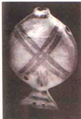
图1-6 甘肃玉门火烧沟遗址出土的夏代鱼形三音孔彩色陶埙

在甘肃玉门火烧沟文化遗址的墓葬中，出土了20多个夏代的彩陶埙，呈鱼形，鱼嘴为吹孔，埙体上有三个按音孔，能吹出相当于后世五声音阶中的do、mi、sol、la四个音，有的还可吹出fa音（见图1-6）。演奏家曾带其到国外表演，被誉为“音乐史上最古老的文明”。