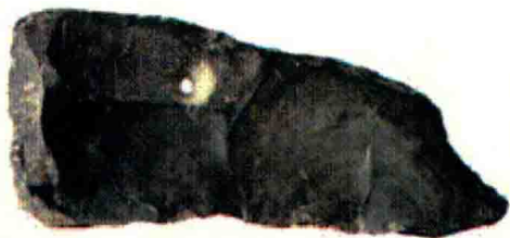
图1-12 山西夏县东下冯出土的夏磬

商代的石磬比前代更注重以线条表现图画和组织画面构图的能力。1950年在河南省安阳市武官村商代大墓中出土的虎纹石磬是迄今为止发现的商磬中形体最大、艺术表现力最完美的一件（见图1-13）。该磬长84厘米，高42厘米，厚仅2.5厘米。正面用双勾细线刻一伏虎作匍匐欲起之状，虎首低垂，怒目圆睁直视前方，虎口向下作咆哮状，鱼形虎尾上扬，栩栩如生。整个磬体的纹饰造型优美，线条流畅，虎形与器形浑然一体，彰显着古代艺术的神秘魅力。