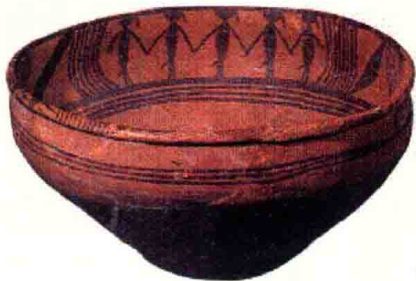
图1-14 青海省大通县出土的新石器时代晚期彩陶盆

1973年出土于青海省大通县上孙家寨墓地的彩陶盆距今有5000多年历史，见证了中国原始乐舞的悠久历史（见图1-14）。陶盆内壁所绘图案分三组，每组有5个人手携手，踏着统一的步伐列队起舞。每组舞者之间又用花纹隔开，体态鲜活，生机盎然。舞者的鸟羽兽尾的头饰、尾饰摆向一致，仿佛让我们感受到鲜明的音乐节奏和韵律。最值得赞叹的是它的图案构思精巧，可以想象当先民们在盆中盛满水时，倒映在水中的舞者的形象就会随着水纹翩翩起舞，给人无尽的审美想象。彩陶盆为我们提供了远古狩猎生活和图腾崇拜的印迹。