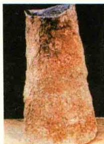
图1-10 山西陶寺出土的夏代鼉鼓