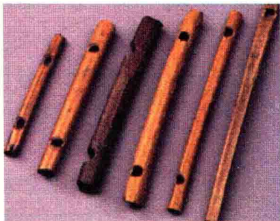
图1-2 浙江余姚河姆渡遗址出土的新石器时代骨哨

1973年在浙江余姚河姆渡遗址中出土了160支骨哨，长4~12厘米不等，一般为两三孔，中空，器身略有弧度（见图1-2）。骨哨多为鸟禽类中段肢骨制成，声音高亢、尖锐，能发出与鸟鸣声相似的音调，虽然能够吹出具有一定音程关系的音高，但从某种意义上说，更接近于一种引诱和捕杀猎物的狩猎工具，还不能算是真正的乐器，因此被认为是具有原始乐器性质的早期乐器形式。经物理测定，这些骨哨距今约有7000年历史。