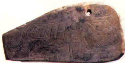
图1-13 河南安阳商代虎纹石磬