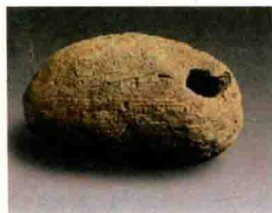
图1-3 浙江余姚河姆渡遗址出土的无音孔陶埙

原始社会的埙多是用陶土烧制而成的圆形或橄榄形的陶埙。距今约六七千年的浙江余姚河姆渡遗址出土的椭圆形无音孔陶埙是目前发现最为古老的埙，造型十分简单，只有一个吹孔（见图1-3）。在陕西西安半坡村遗址发现的两个橄榄形陶埙距今约6000年，其中一个无音孔，另一个有一音孔能吹出一个小三度音程，即F与 \flat A两个音（见图1-4）。在山西万荣县荆村和太原市义井村，分别发现了二音孔陶埙，都能吹出三个音（见图1-5）。