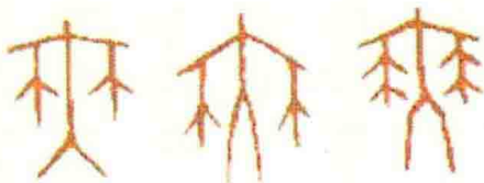
图1-15 甲骨文中的“舞”字与“巫”同源

《葛天氏之乐》是一部具有史诗性质的作品，无论从其规模还是复杂程度来看，都已相当完整。甲骨文“舞”字的形状就是一个人手持牛尾手舞足蹈的样子（见图1-15）。《葛天氏之乐》不仅是中国最早的歌舞，而且是中国第一部有文字记载的歌舞，是中华民族文化艺术的重要源头之一。