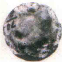
图1-5 山西万荣县荆村出土的二音孔陶埙