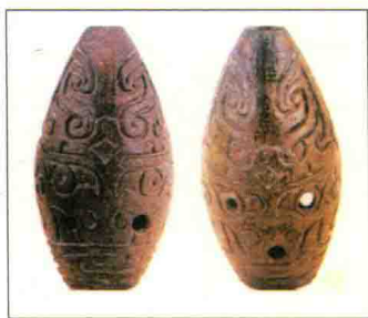
图1-7 河南安阳殷墟出土的兽面纹五音孔骨埙