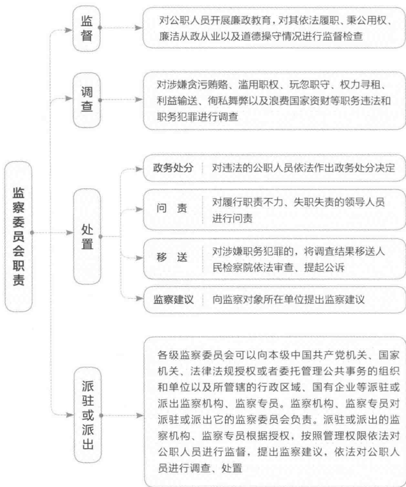
> 图 1-2 监察委员会职责

人员，主要是国有独资企业、国有控股企业及其分支机构的领导班子成员；对国有资产负有经营管理责任的中层和基层管理人员；在管理、监督国有资产等重要岗位上工作的人员。国有企业所属事业单位领导人员、国有资本参股企业和金融机构中对国有资产负有经营管理责任的人员，也属于国有企业管理人员的范畴。