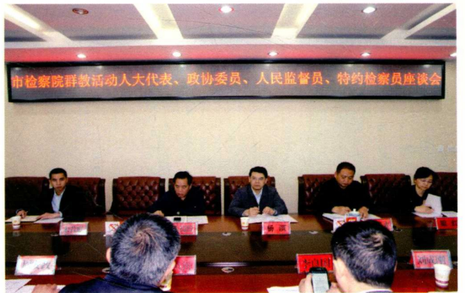
市检察院召开人大代表、政协委员 人民监督员、特约检察员座谈会