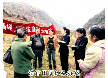
法官田间地头办案

的干警采取待岗学习、劝退等方式予以清除。对8个基层法院进行了司法巡查，在审务督察、作风巡查中对4个基层法院、8名个人问责；在廉洁司法建设上，