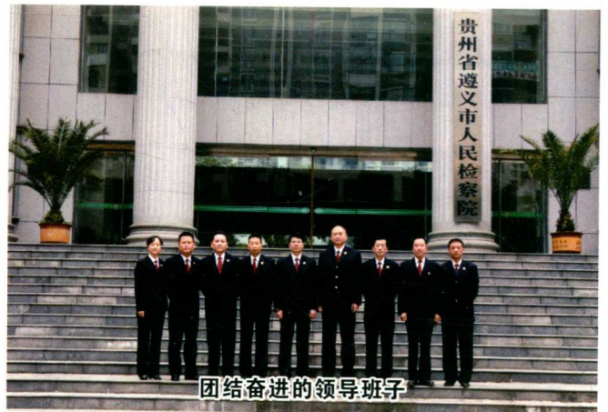
团结奋进的领导班子

员12人、法警9人；副厅长级1人，县处级21人，科级72人，科员级27人；硕士研究生4人，大学98人，大专19人。