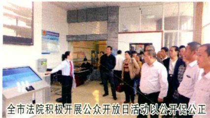
全市法院积极开展公众开放日活动以公开促公正

制定了《2014年全市法院司法改革工作意见》，汇川区法院被省法院确定为全省司法体制改革试点单位。市中院创新审判权力监督机制，实行审判委员会讨论再审改判案件同时议定办案质量责任和违法审判责任做法；创新执行工作机制，现已制定网上司法拍卖操作流程，将法院强制执行财产在“淘宝网”上公开拍卖；创新审判管理机制，在全省首创未成年被告人心理评估机制，由法官会同心理咨询师对被告人进行庭前心理测评、庭审教育、判后心理矫治，心理评估结果作为量刑参考，被《人民法院报》推广；创新审限承诺制度，在尊重审判规律的原则下，各业务庭向分管院领导承诺在一审限内最短时间内结案；创新审判资源配置，建立院领导以及具有审判资格的综合行政后勤人员办案机制，既为审判组织结构改革做好准备，也缓解办案力量不足问题。