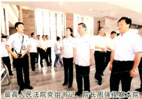
最高人民法院党组书记、院长周强视察本院

近年来，遵义中院在以刘力为班长的新一届党组的带领下，紧紧围绕“努力让人民群众在每一个司法案件中都感受到公平正义”目标，牢牢把握“司法为民公正司法”主线，不断践行