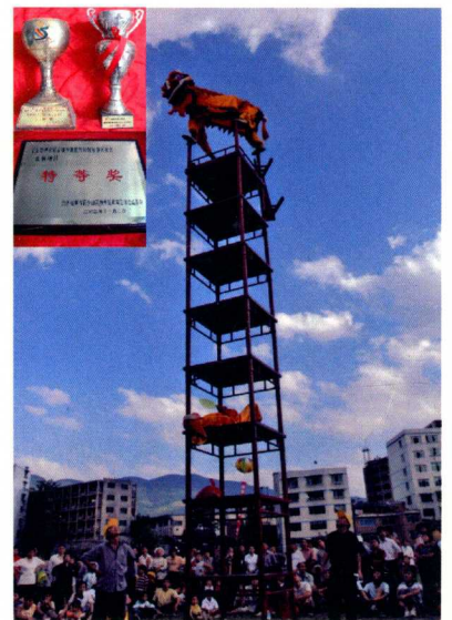
道真自治县高台舞狮(左面为获得的全国性奖项)

认真贯彻落实国发2号和黔党发5号文件精神，开展民族团结进步示范三级联创活动，今年共创建示范点59个。活动开展以来，累计投入创建经费3000余万元，整合社会资金近8亿元，创建示范点108个，其中省级76个，市级32个；汇川区航宇社区被国家民委授予“第二批全国民族团结进步创建活动示范单位”。开展党的民族理论、民族政策、民族法律法规和民族基本知识“四项”教育进机关、进学校、进社区、进村寨、进企业、进部队“六进”活动。其中进学校21个、进社区17个、进村寨46个、进企业11个、进部队8个，不断增强各族干部群众的法律意识、公民意识和民族团结意识。切实做好城市民族工作。认真贯彻落实国家民委、民政部《关于加强新形势下社区民族工作的意见》，进一步深化民族事务服务体系，在全市推广红花岗区