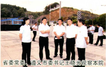
省委常委、遵义市委书记王晓光视察本院

着力服务经济社会发展大局，稳妥审理各类民事纠纷案件54157件；着力正确处理判决与调解的关系，注重以调解方式化解矛盾纠纷，全市法院诉前调解1099件，立案调解1434件，民事事调撤率占71.92%；着力强化专业化审判，两级法院设立重大项目合议庭、金融合议庭、涉军合议庭等专业合议庭；着力保障创新驱动战略实施，市中院