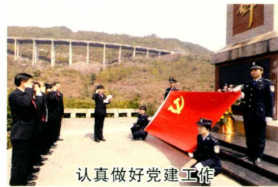
认真做好党建工作

在思想政治建设上，始终以党的群众路线教育实践活动为统揽，市中院组织了“站在新起点、实现新发展”、“敬业