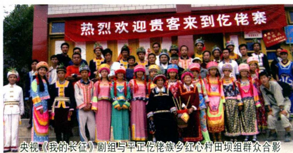
央视《我的长征》剧组与平正仡佬族乡红心村田坝坝组群众合影

事务治理体系改革实施方案》、《遵义市深化宗教事务治理体系改革实施方案》2个总体方案，全面启动了《遵义市深化民族经济改革实施方案》、《遵义市深化民族文化教育改革实施方案》等8个专题方案的组织实施工作；以民族事务服务体系建设为载体，扎实开展城市民族工作，让城市更好接纳少数民族群众，让少数民族群众更好融入城市；弘扬和保护民族传统文化，加强“双语”教育，推动民族文化、教育等民族地区社会事业健康发展；加强少数民族党政人才和专业技术人才培养，为民族工作提供坚实智力支持和人才保障。