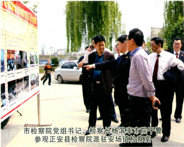
市检察院党组书记、检察长杨滨率市院干警 参观正安县检察院派驻安场镇检察室

2012年1月至2014年8月，全市检察机关共立案查办职务犯罪案件450件584人，其中贪污贿赂犯罪案件352件367人（年均163人），大案316件，大案率为98.8%；渎职侵权犯罪案件99件117人（年均40人），重特大案件42件，占案件总数42%；通过办案为国家挽回直接经济损失3723万余元。共批准逮捕刑事犯罪7904件12577人（年均4716人），提起公诉11419件17228人（年均6456人）。