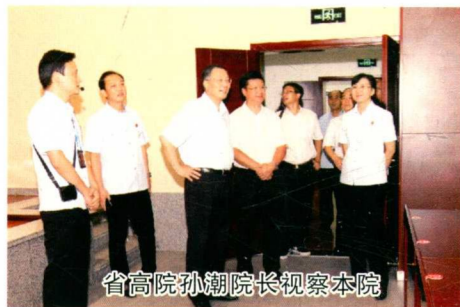
省高院孙潮院长视察本院

稳妥审结行政案件1129件。强化协调意识与坚持依法协调并重，行政案件协调撤诉率为28.06%；支持依法行政与纠正违法行为并重，对于行政机关合法的具体行政行为，动员原告主动撤诉或履行义务。对于行政机关违法的具体行政行为，要求行政机关以积极的态度主动改正其违法的行政行为；突出司法审查与行政执法的良性互动并重，坚持每年发布行政审判白皮书，定期召开行政审判联席会议和举办培训讲座。