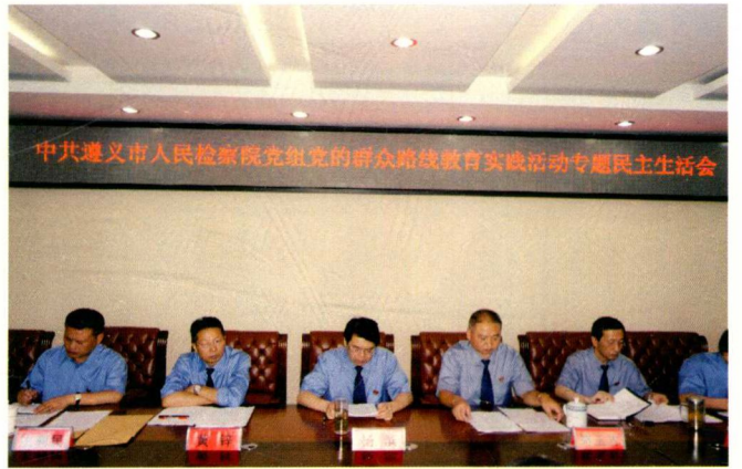
市检察院召开党的群众路线 教育活动专题民主生活会

越发展主基调，以遵义检察文化建设为主线，不断加强执法规范化建设、检察队伍建设、基层检察院建设，强化法律监督，为遵义率先在全省实现全面小康、率先实现现代化目标而奋斗。