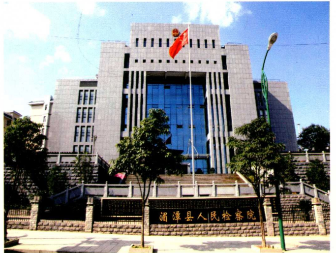
焕然一新的基层检察院