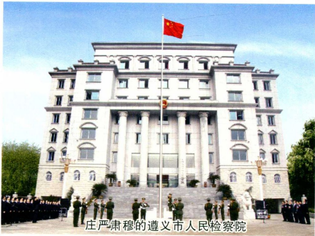
庄严肃穆的遵义市人民检察院

遵义市位于贵州省北部，是全国首批历史文化名城，是贵州最大的工业城市，以遵义会议和生产国酒茅台而驰名中外，面积约30762平方公里，总人口约760万人，辖14个县、自治县、区（市）。全市两级共15个检察院，有政法专项编制927名，实有人员831名，其中检察官648人、书记员106人、法警77人；副厅长级1人，县处级36人，科级387人，科员级407人；硕士研究生16人，大学606人，大专155人，检察专业证书37人，中专及高中以下学历17人。市院机关政法专项编制数130名，实有在编人员121人，其中检察官100人、书记