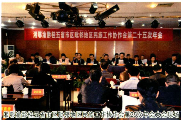
湘鄂渝黔桂五省市区毗邻地区民族工作协作会第25次年会大会现场

在遵义这片热土上，勤劳、智慧的各族人民创造了悠久灿烂的文明，续写着一个又一个的辉煌业绩。遵义是一个多民族杂居地区，少数民族分布呈大杂居、小聚居、相互交错居住、人口少、分布广等特点。境内有仡佬、苗、土家、彝、布依、侗、回、满等47个少数民族，有2个自治县、8个民族乡，少数民族人口92万，占全市总人口的12%。其中，仡佬、苗、土家3个民族为世居主体民族，仡佬族约45万人，占全国仡佬族总人口的70%，苗族约26万人，土家族约10万人，其余少数民族人口均只有1000人左右或不足1000人。