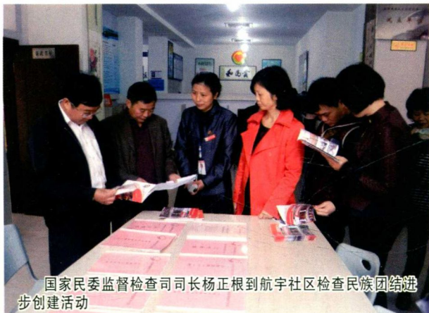
国家民委监督检查司司长杨正根到航宇社区检查民族团结进步创建活动

2014年，全市受国务院第六次民族团结进步表彰大会表彰的民族团结进步模范集体3个、模范个人4人。