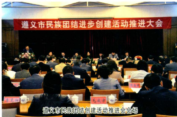
遵义市民族团结进步创建活动推进会场

法治方法助推新形势下民族宗教工作创新发展；并成立了深化民族宗教事务治理体系改革工作领导小组，明确了牵头领导和责任科室，组织制定了《遵义市深化民族