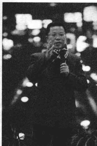
在读书人俱乐部演讲