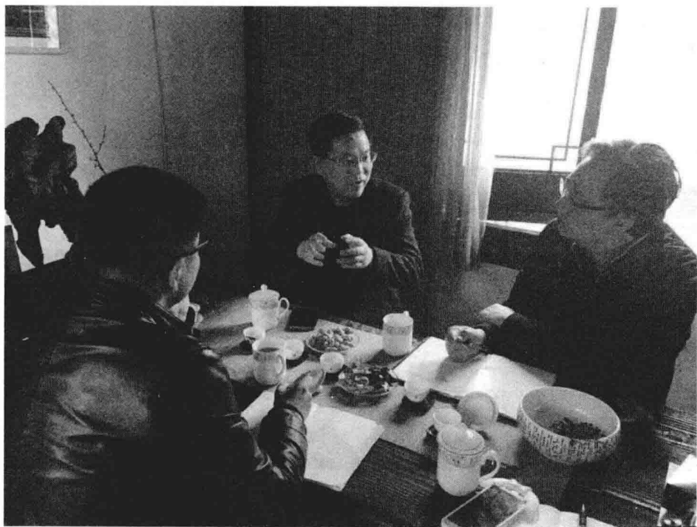
作者与中国规划设计院专家组交流宁波远期规划