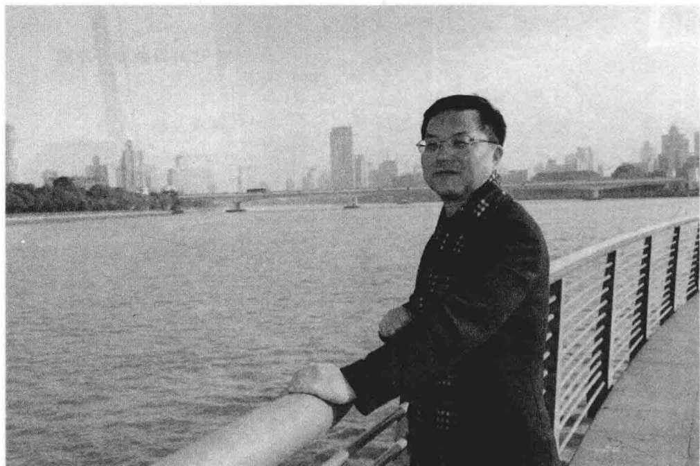
作者在姚江畔