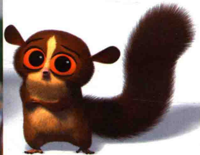
《马达加斯加》里的狐猴，毛发非常精细，但是还是和真实的狐猴不同，外表充满卡通感，夸大了狐猴的眼睛，填上了眉毛，赋予了拟人化的表情，变得更加可爱。