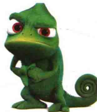
变色龙的写实到卡通化的设计，中间的角色外形高度简化，概况，不表现皮肤质感。右边的角色比前者稍微写实一些，材质表现细腻，但外形依旧夸张并做了拟人化的处理。