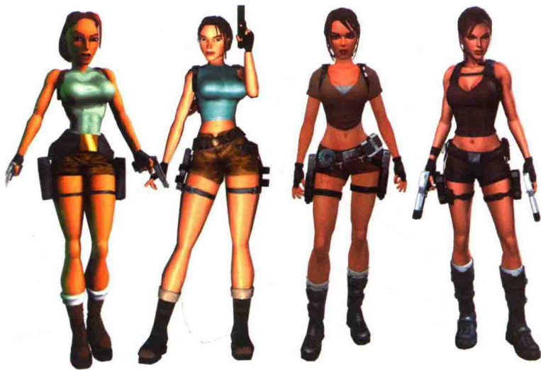
《古墓丽影》里的劳拉进化史，同样是性感的劳拉，给人的感染力却有着很大的差别。从过去的卡通走到了今天写实的层次，毛发、皮肤非常精细。

随着数字技术的普及，特效类电影、次世代游戏的发展，创造了前所未有的视觉真实感。细腻逼真的角色成为设计的一种追求，越来越成为人们喜欢的一种表现形式。写实类的角色既能模拟现实中的人和一切生物，也可以制造出千奇百怪的奇幻生物。