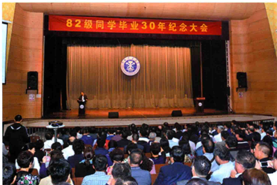
10月2日，学校在文昌校区科学馆举行82级同学毕业30周年纪念大会。