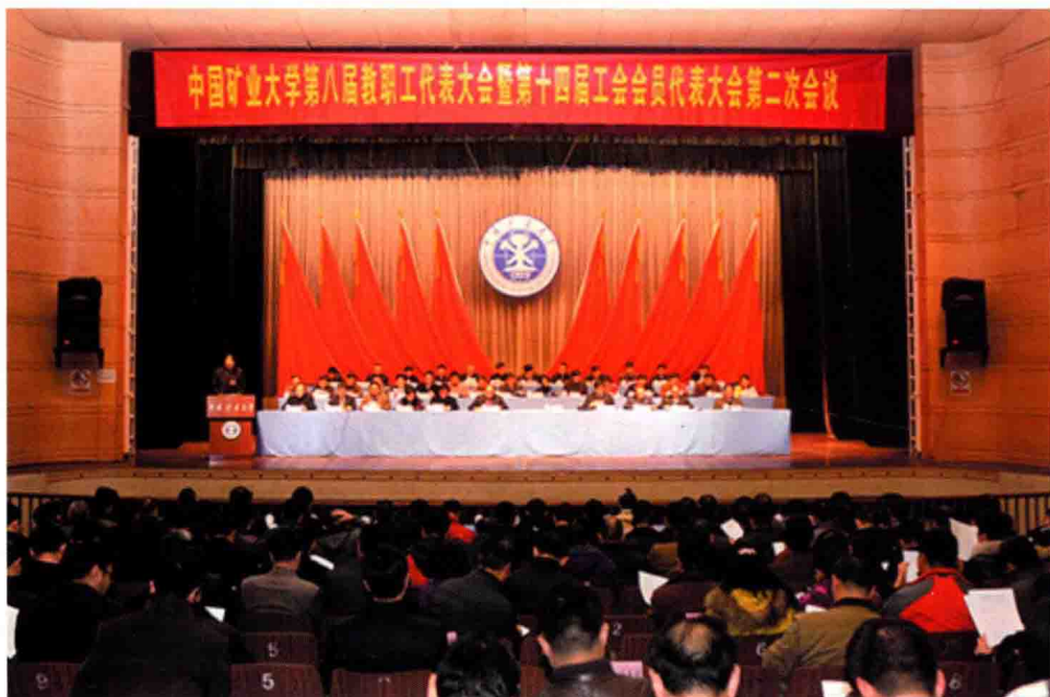
3月2~5日，学校在文昌校区科学馆举行第八届教职工代表大会暨第十届工会会员代表大会第二次会议。