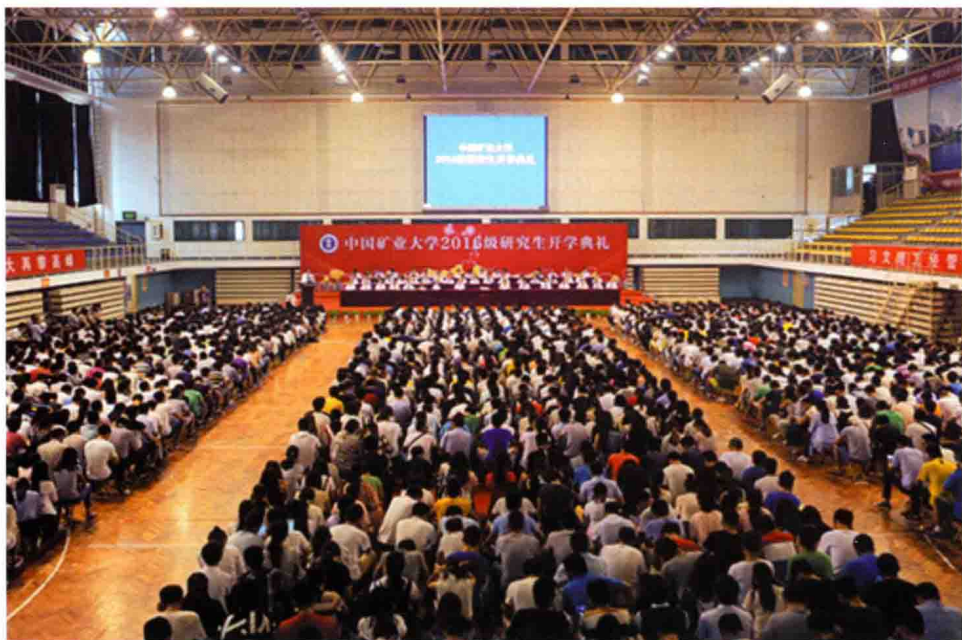
9月5日，学校在文昌校区体育馆举行2016级研究生开学典礼。