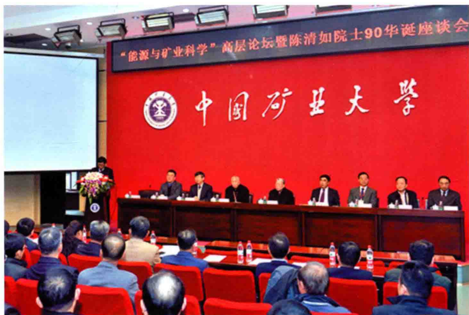
12月3日，学校举办“能源与矿业科学”高层论坛暨陈清如院士90华诞座谈会。