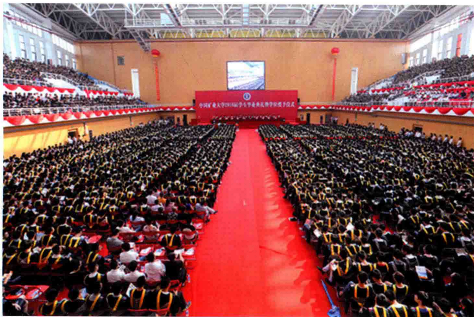
6月22日，学校在南湖校区体育馆举行2016届学生毕业典礼。