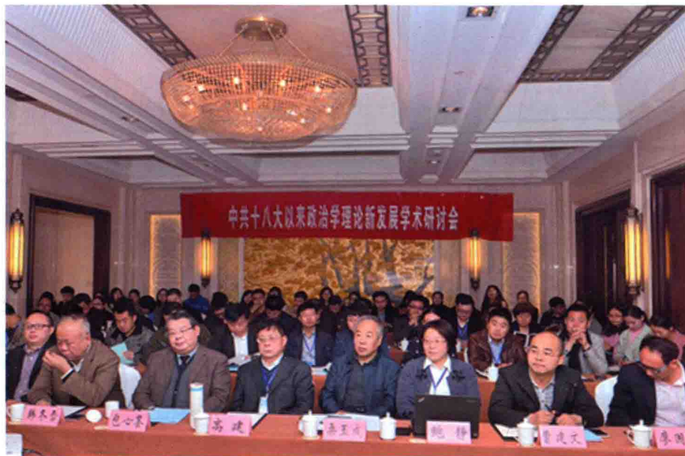
3月18~20日，中共十八大以来政治学理论新发展学术研讨会在我校召开。