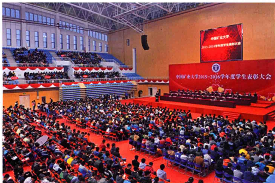
11月9日，学校在南湖校区体育馆举行2015~2016学年度学生表彰大会。