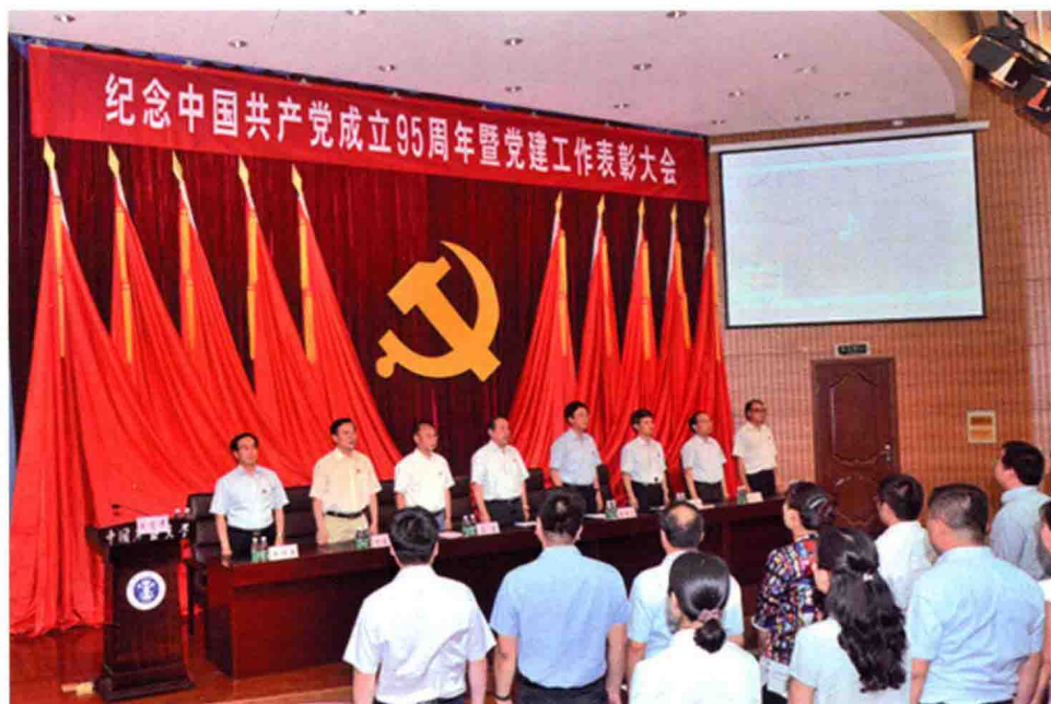
6月29日，学校举行庆祝建党95周年暨党建工作表彰大会。