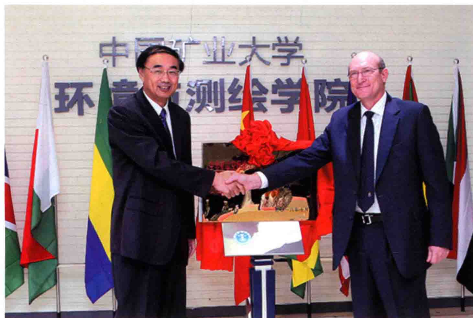
10月27日，中非矿山空间地理信息国际合作联合实验室在我校成立。 图为Frederick Cawood教授与葛世荣校长共同为联合实验室揭牌。