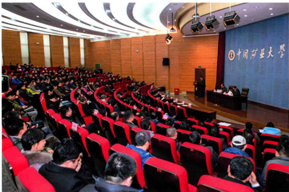
11月25日，学校召开干部教师大会总结就新一轮中层领导班子换届和处级干部聘任工作。