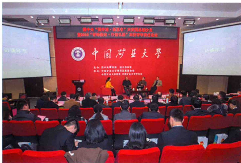
11月17~18日，团中央“团学道·新思享”思想沙龙暨“青锋徐来·行健弘毅”高校青年责任论坛在我校举行。