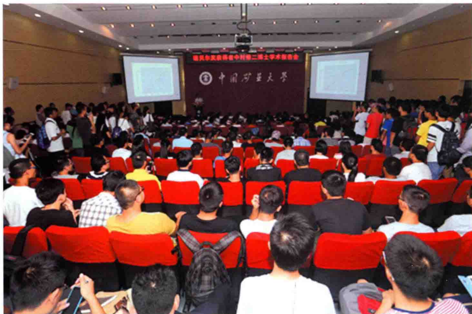
9月15日，学校举行中村修二教授受聘名誉教授仪式暨学术报告会。