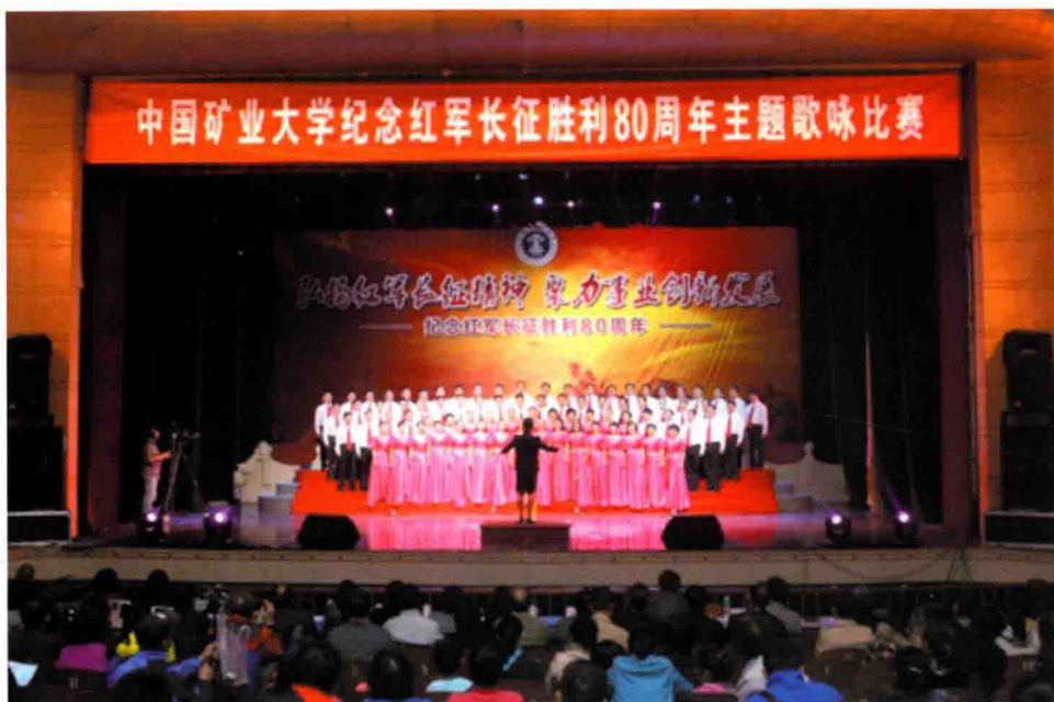
10月23日，学校举办纪念红军长征胜利80周年主题歌咏比赛。