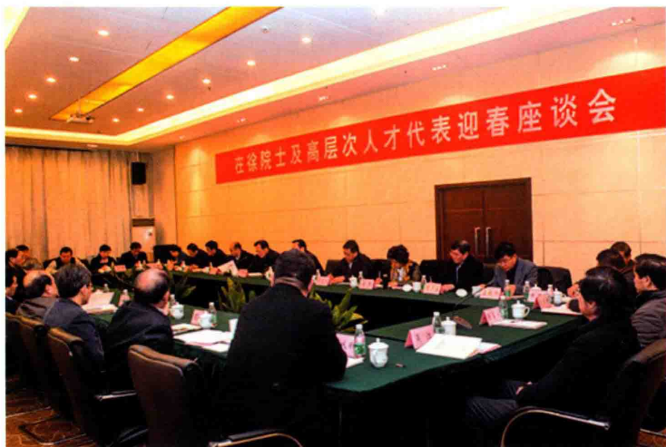
2月4日，在徐院士及高层次人才代表迎春座谈会在我校举行。