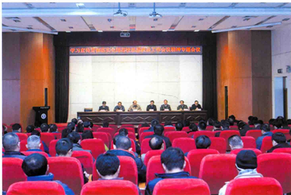
11月22日，学校召开学习贯彻落实全国高校思想政治工作会议精神专题会议。