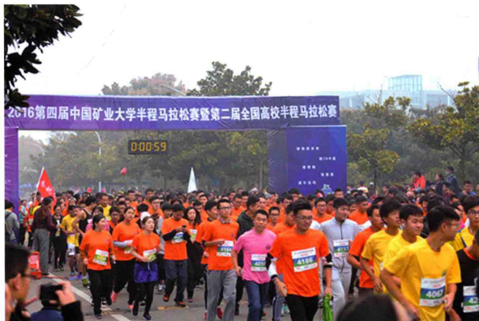
11月6日，第四届中国矿业大学半程马拉松赛暨第二届全国高校半程马拉松赛在我校举行。