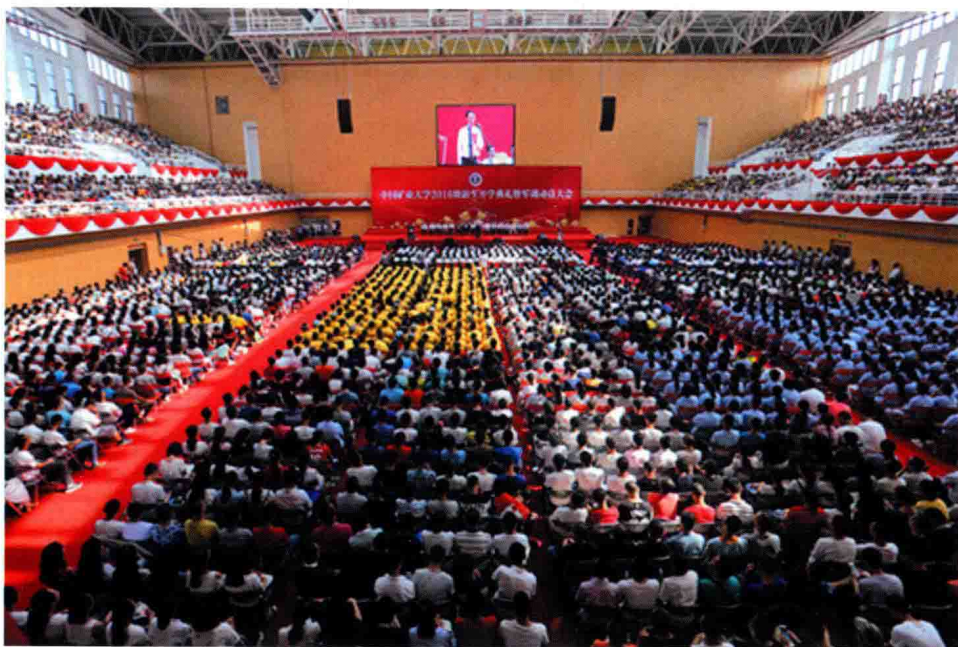
9月5日，学校在南湖校区体育馆举行2016级本科生开学典礼暨军训动员大会。