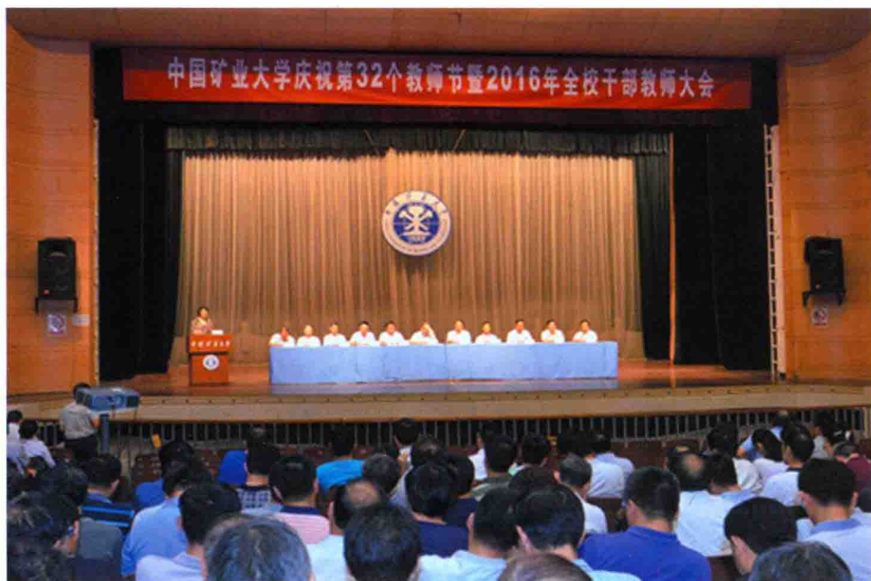
9月7日，学校在文昌校区科学馆举行庆祝第32个教师节暨2016年全校干部教师大会。