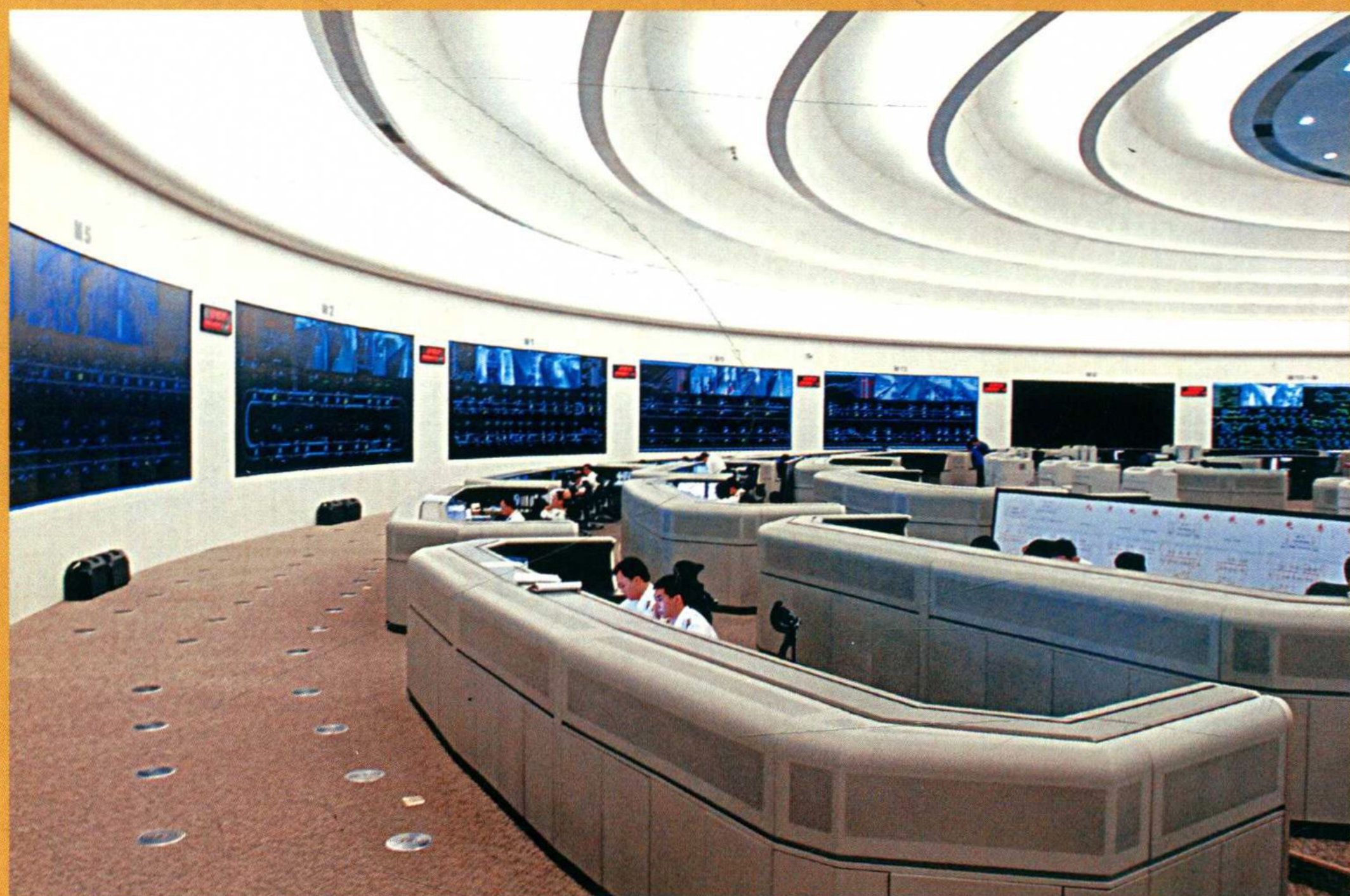
轨道交通指挥中心