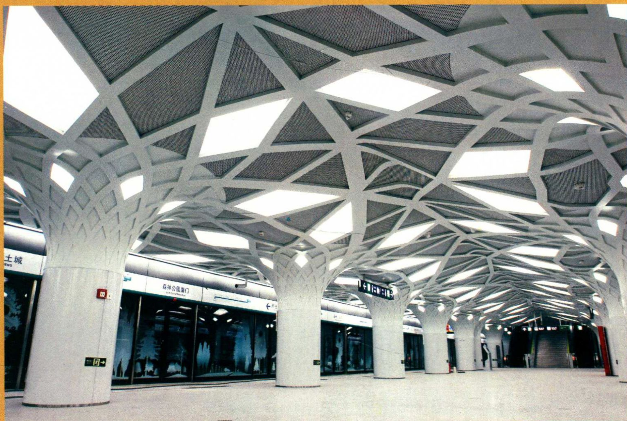
▶ 奥运支线森林公园南门站