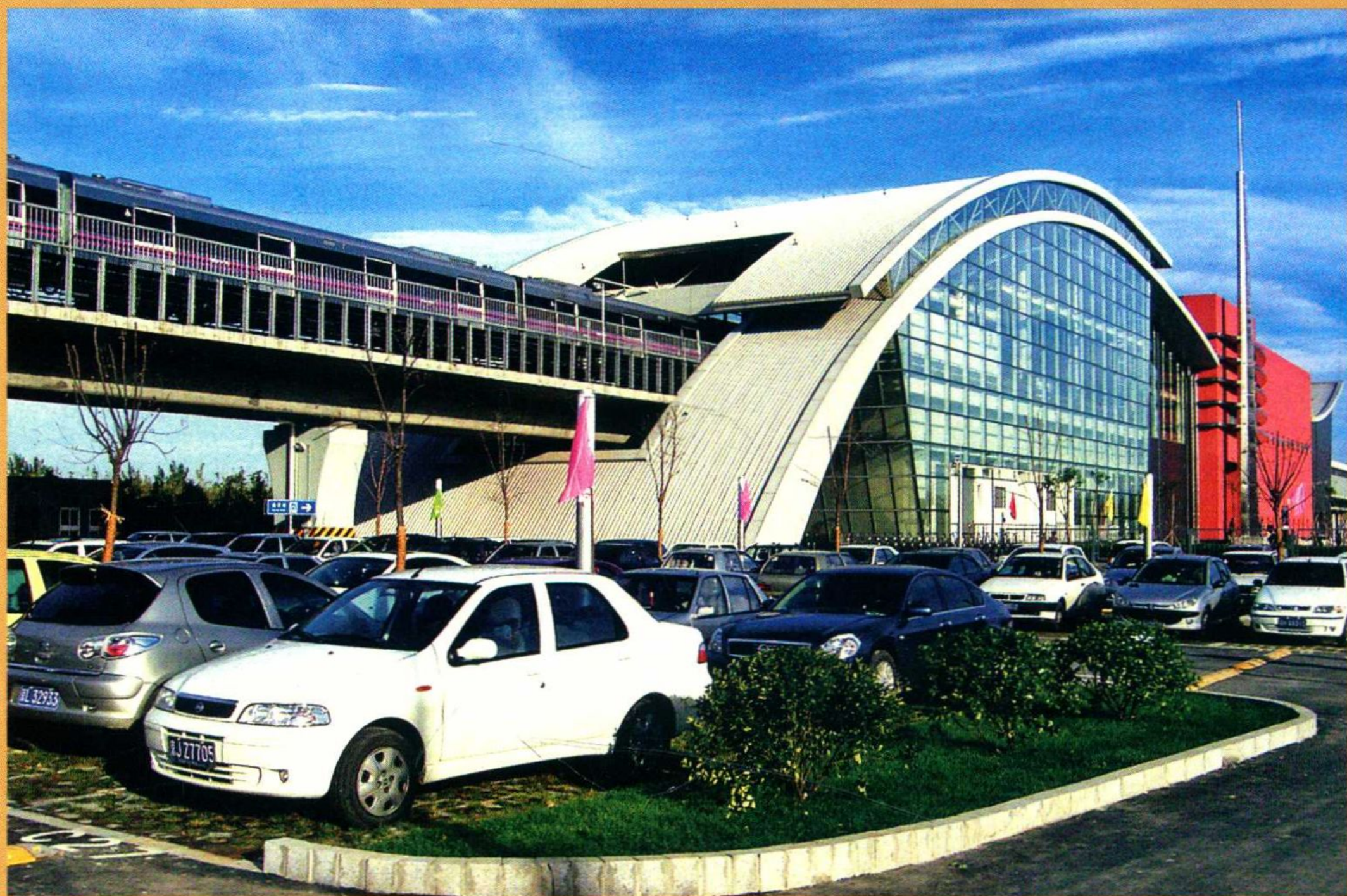
换乘便捷的地铁站