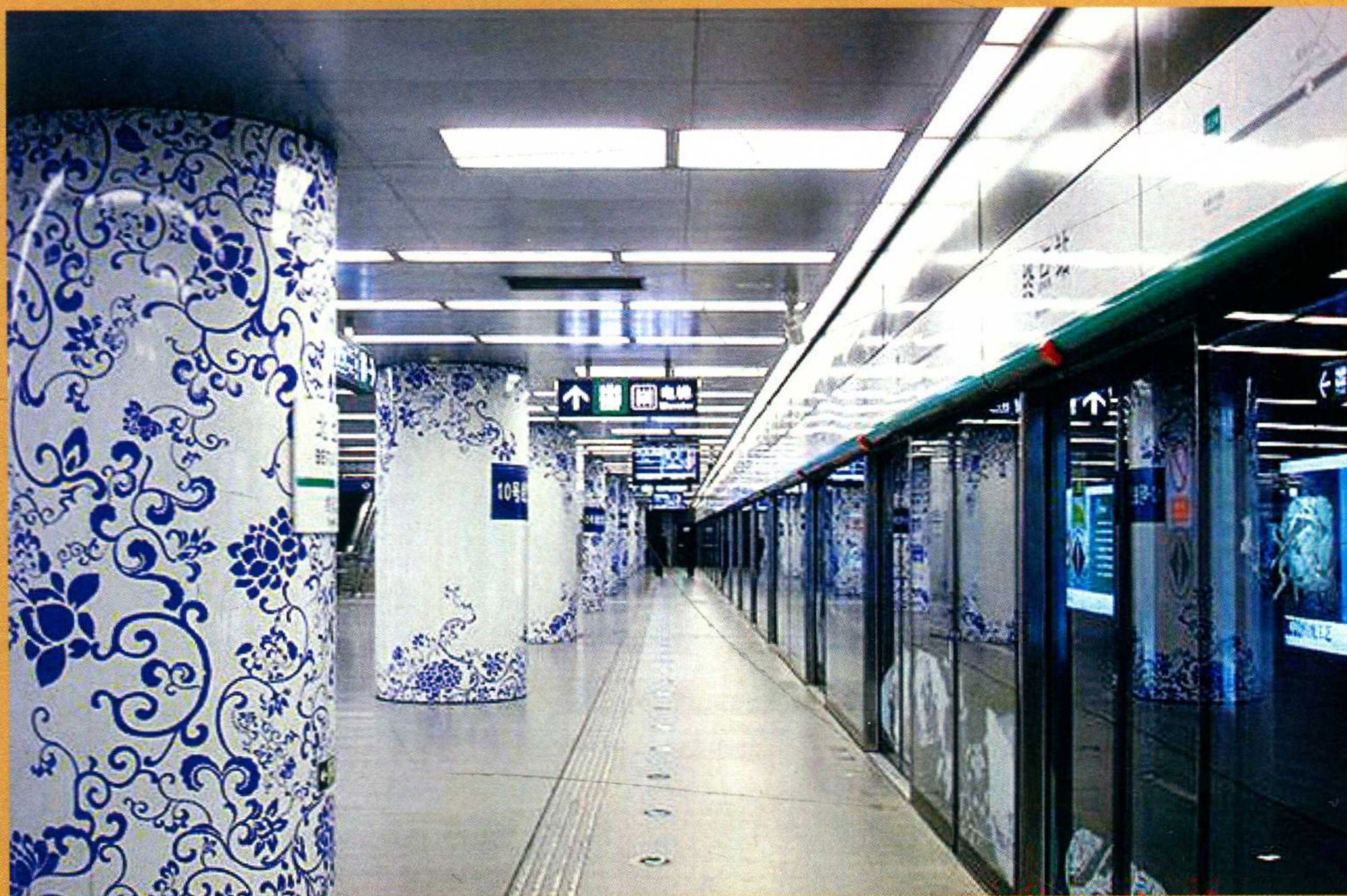
▶ 奥运支线北土城站