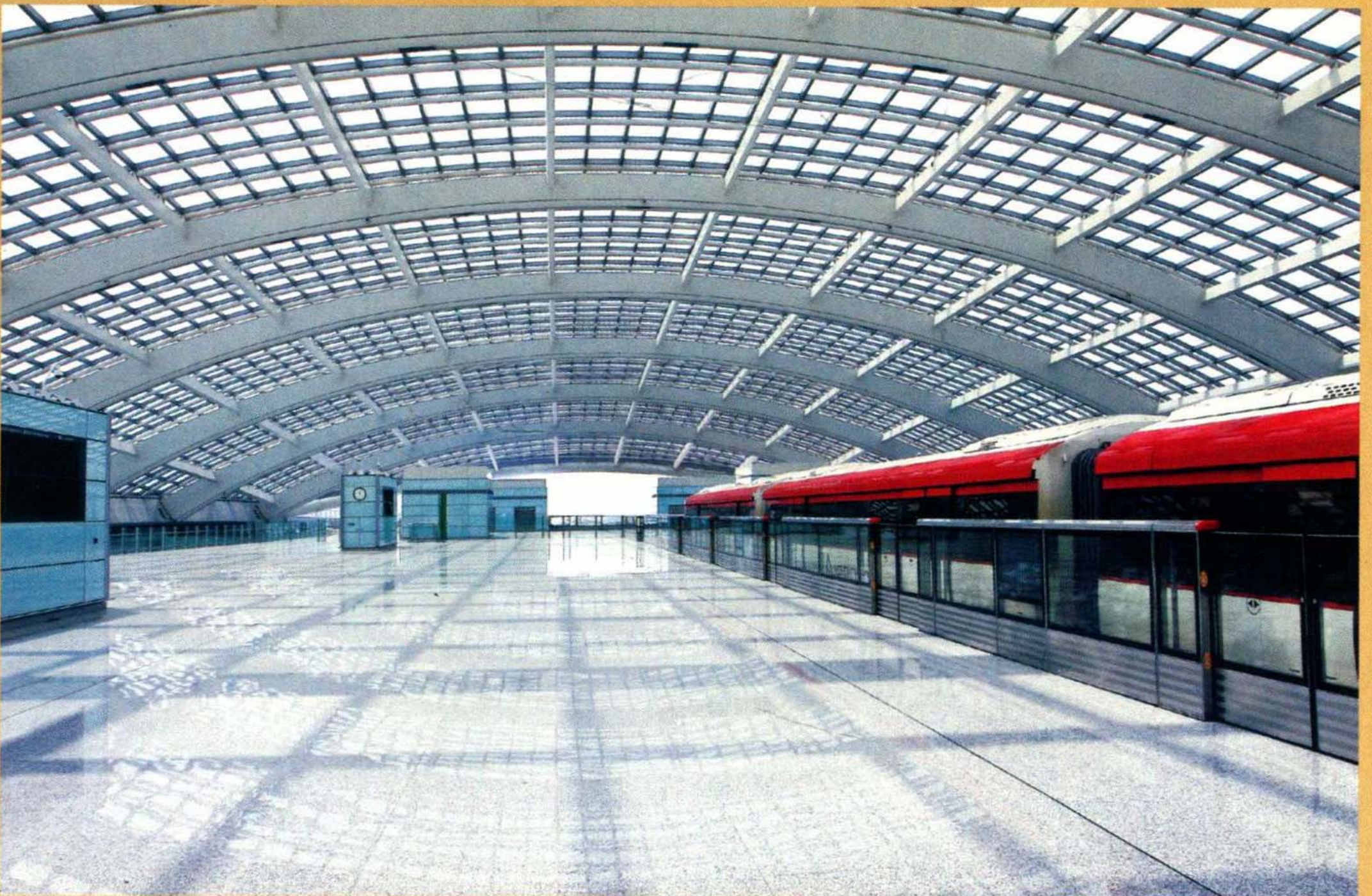
➤ 机场线3号航站楼站