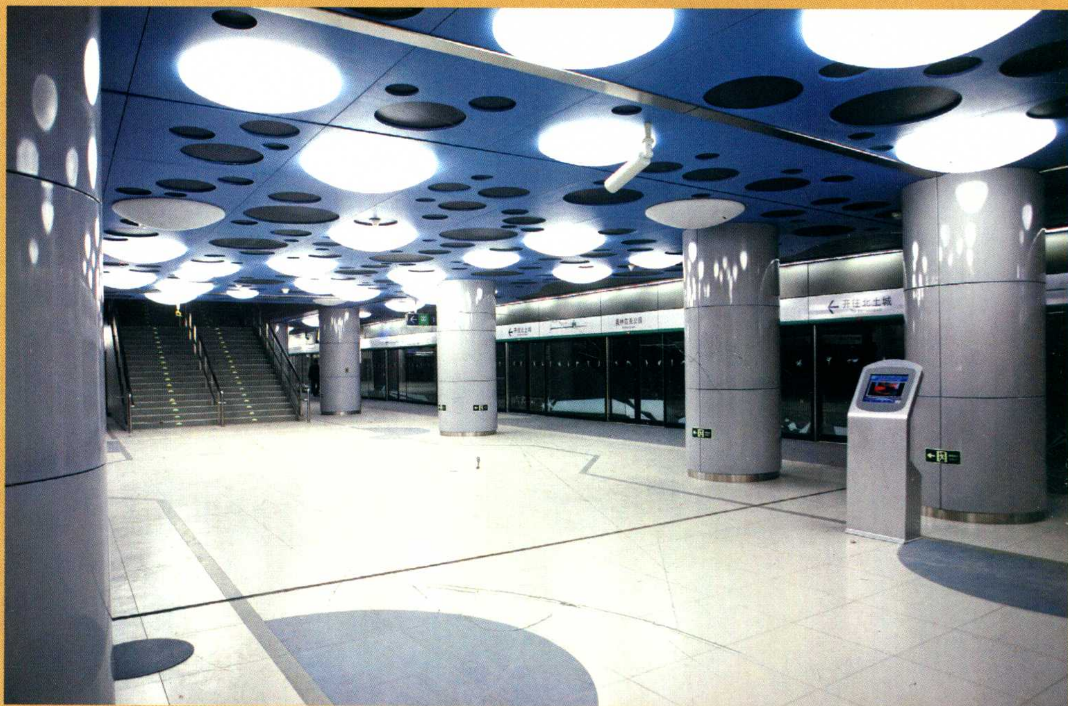
▶ 奥运支线奥林匹克公园站