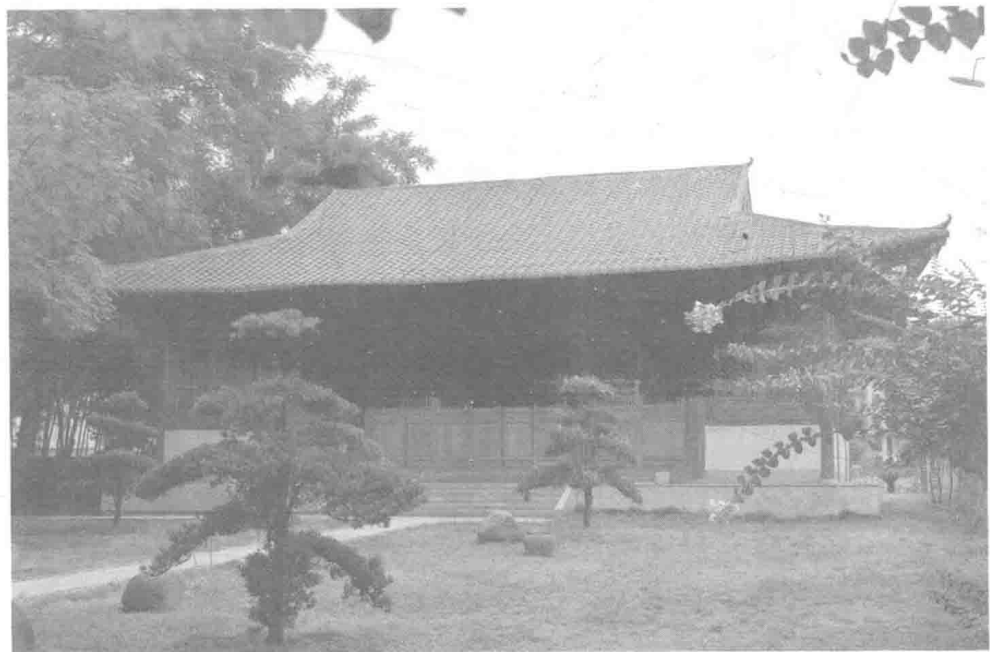
崇雒乡宋慈纪念园中的宋慈纪念馆

在吴稚的书堂，宋慈还有两位要好的同学，一位叫熊刚大，一位叫祝穆。还有一位老先生常常造访，老先生姓刘名准，号溪