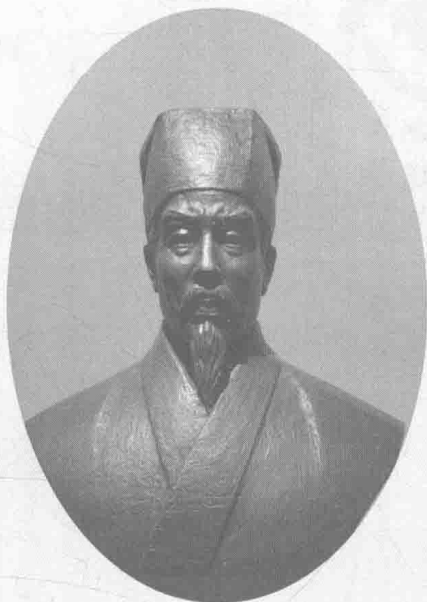
宋 慈 (1186-1249)