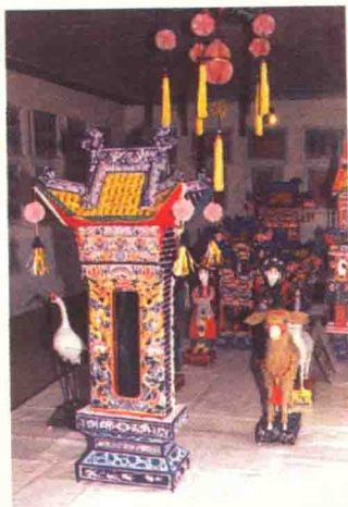
图10 丧俗纸扎 (甘肃西峰)