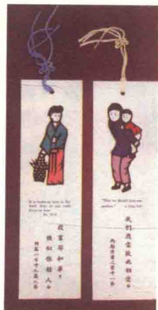
图17 剪纸书签（山东牟平）