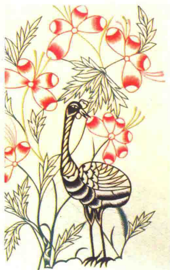
图1 鹤（山东莱州）拼色剪纸