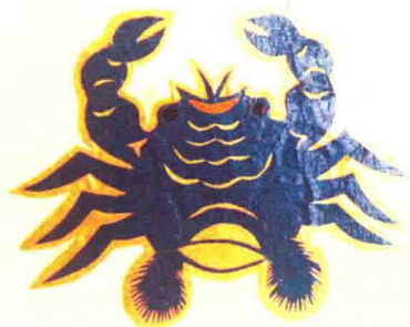
图2 蟹（山东莱州）衬色剪纸