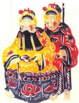
图4 戏曲人物（蔚县王老赏） 点染剪纸