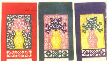
图8 花瓶(山东苍山) 挖补门笪