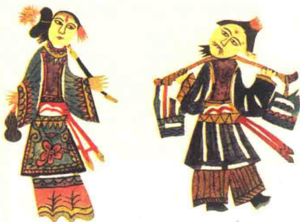
图3 锯大缸（山东莱西）勾绘剪纸