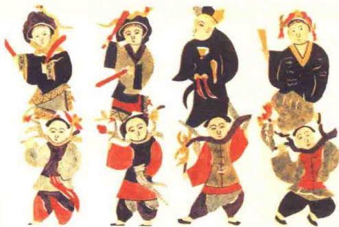
图14 金山寺站钎（清代山东 牟平孙绪民）勾绘剪纸