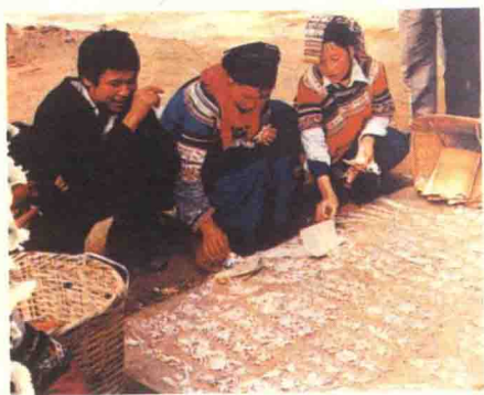
图11 出售花样 (云南元阳县彝族)