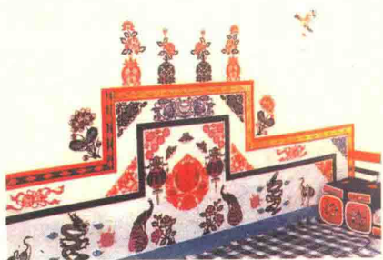
图6 炕围花(陕西凤翔)