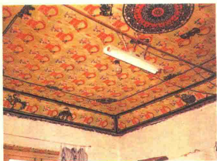
图7 顶棚花(山东莱州)