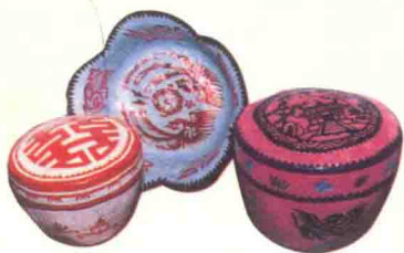
图12 纸斗筐箩 (山东莱成)