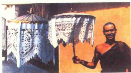
图9 佛伞花 (云南傣族)