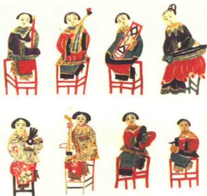
图15 女乐（清代山东牟平 孙绪民）勾绘剪纸