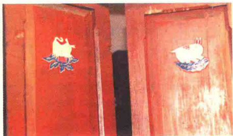
图5 艾虎艾兔(山东蓬莱)门花