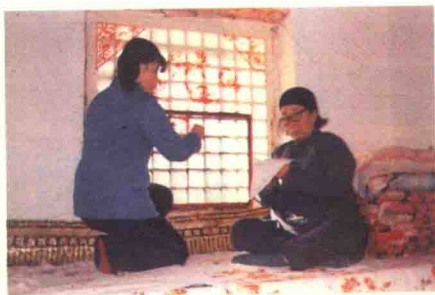
图13 学剪纸 (山东莱州)