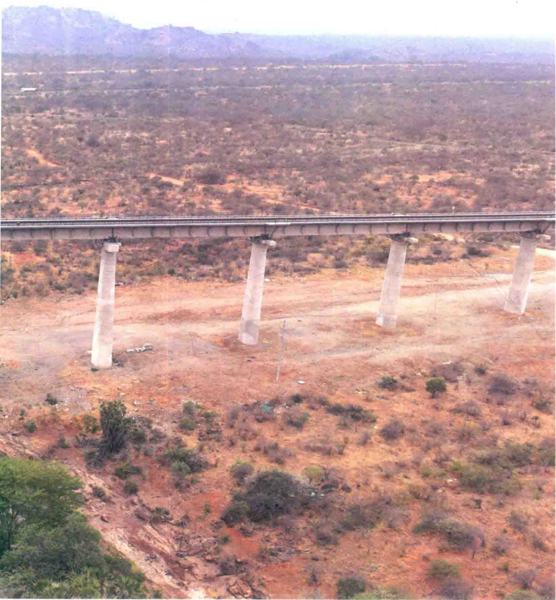
蒙内铁路打造绿色通道——察沃河特大桥