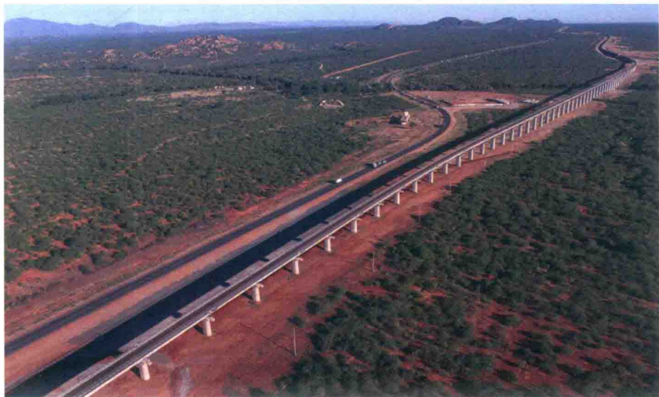
空中俯瞰蒙内铁路