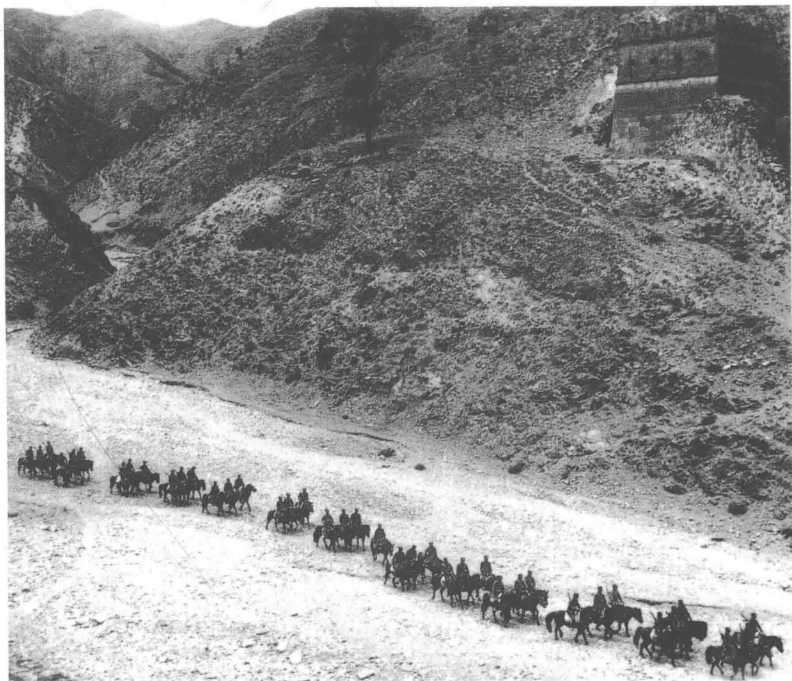
0001 八路军开赴抗日前线。