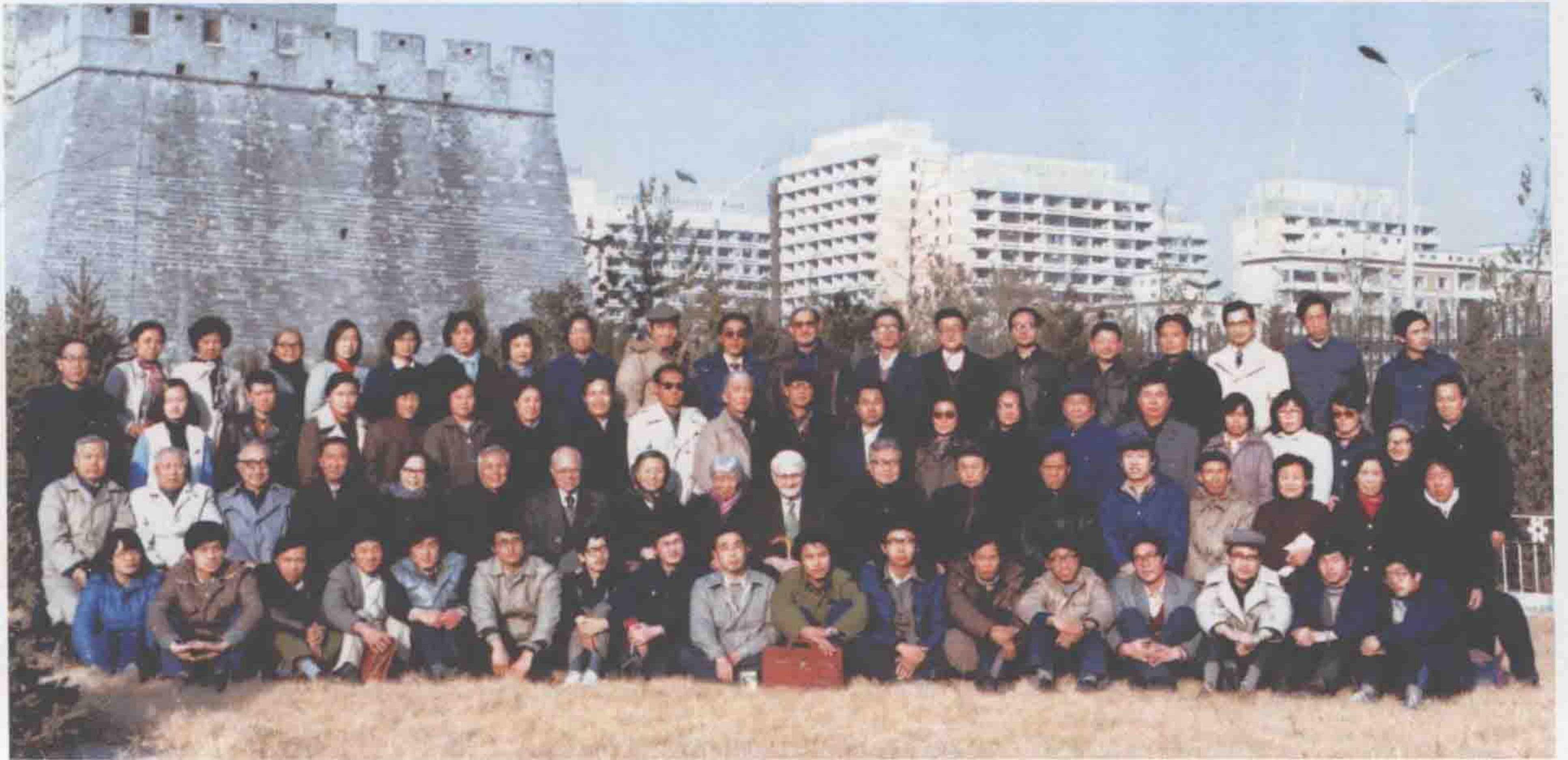
李约瑟与自然科学史研究所同事合影（1986年11月）