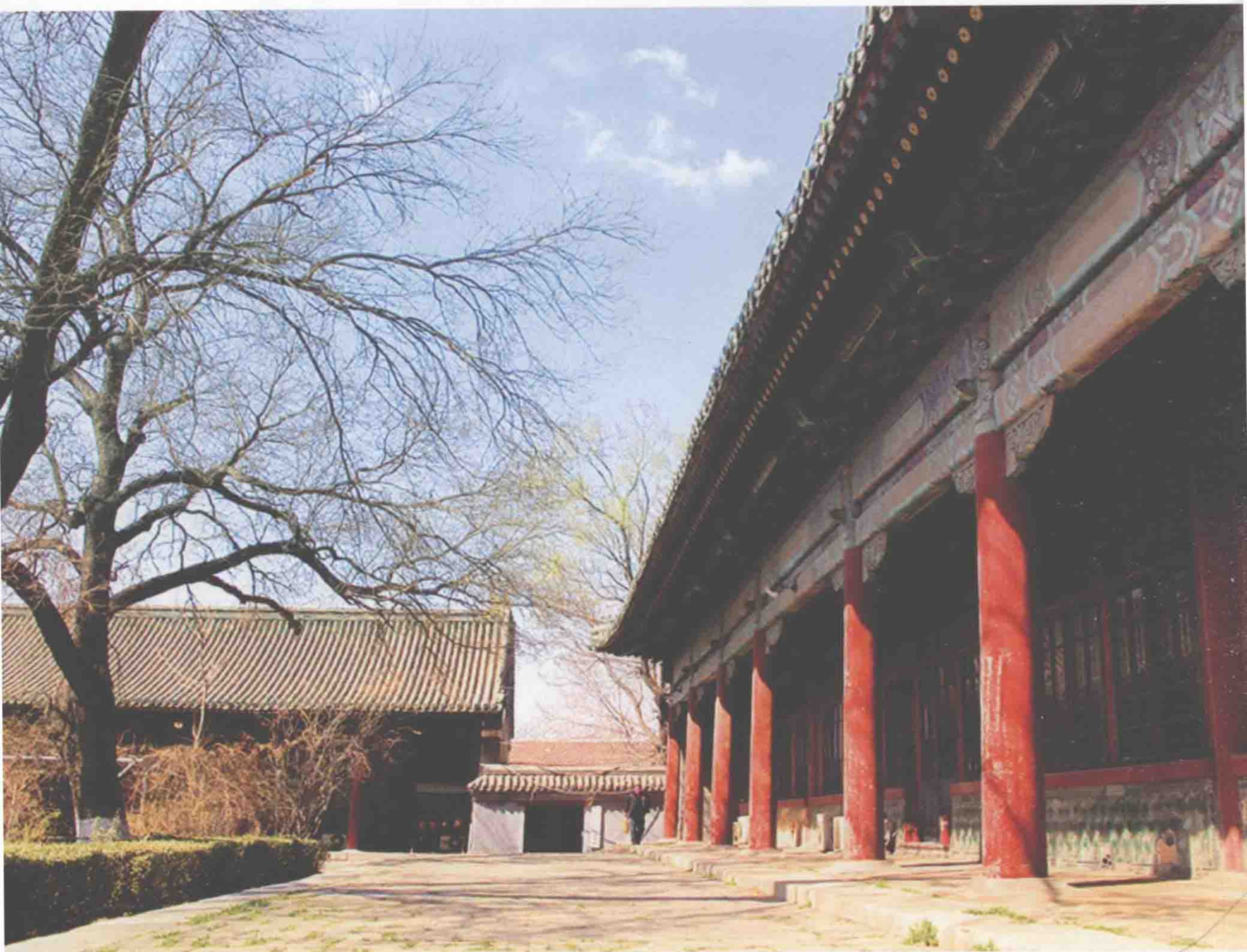
研究所旧址：北京市东城区朝阳门内大街137号孚王府