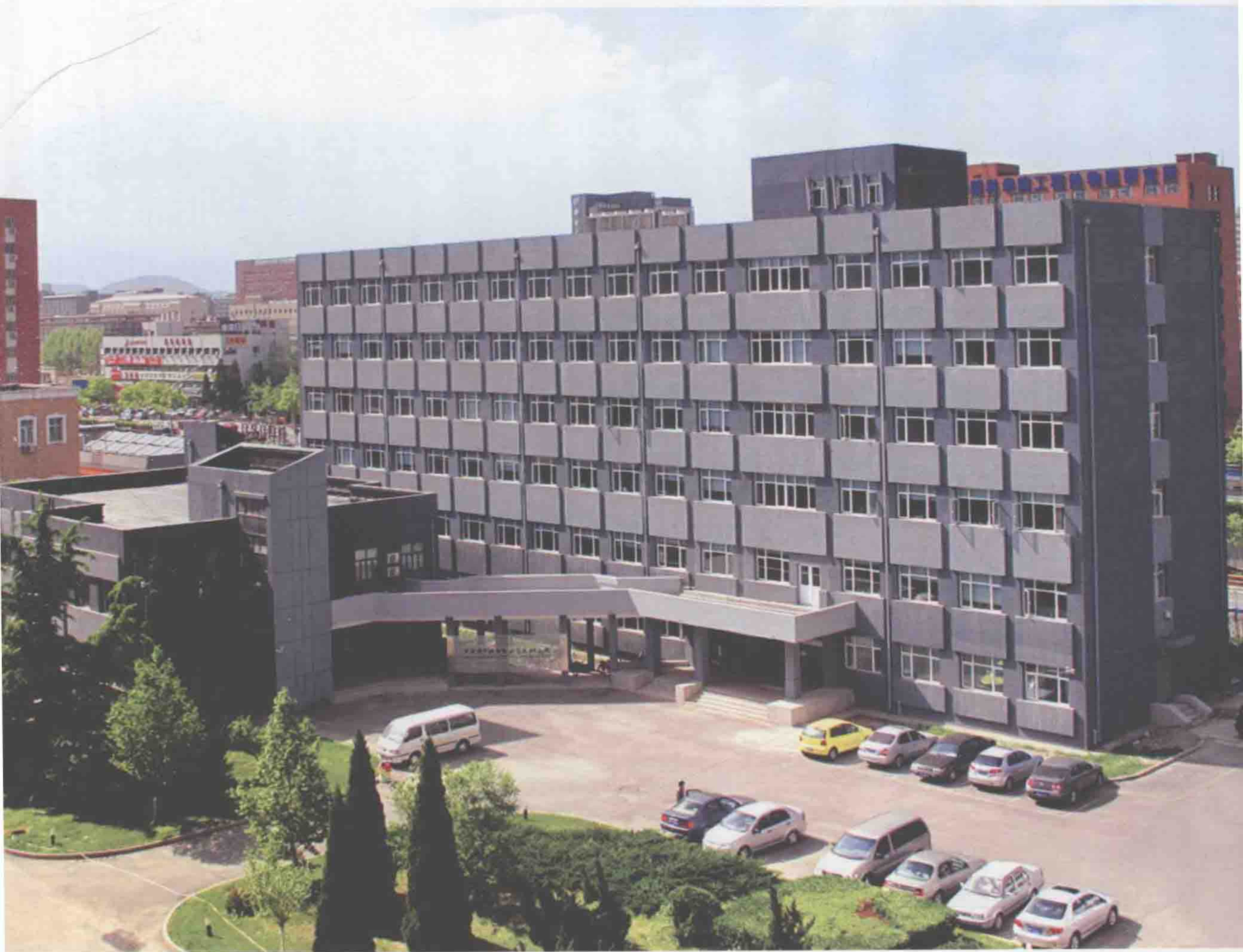
研究所新址：中国科学院基础科学园区