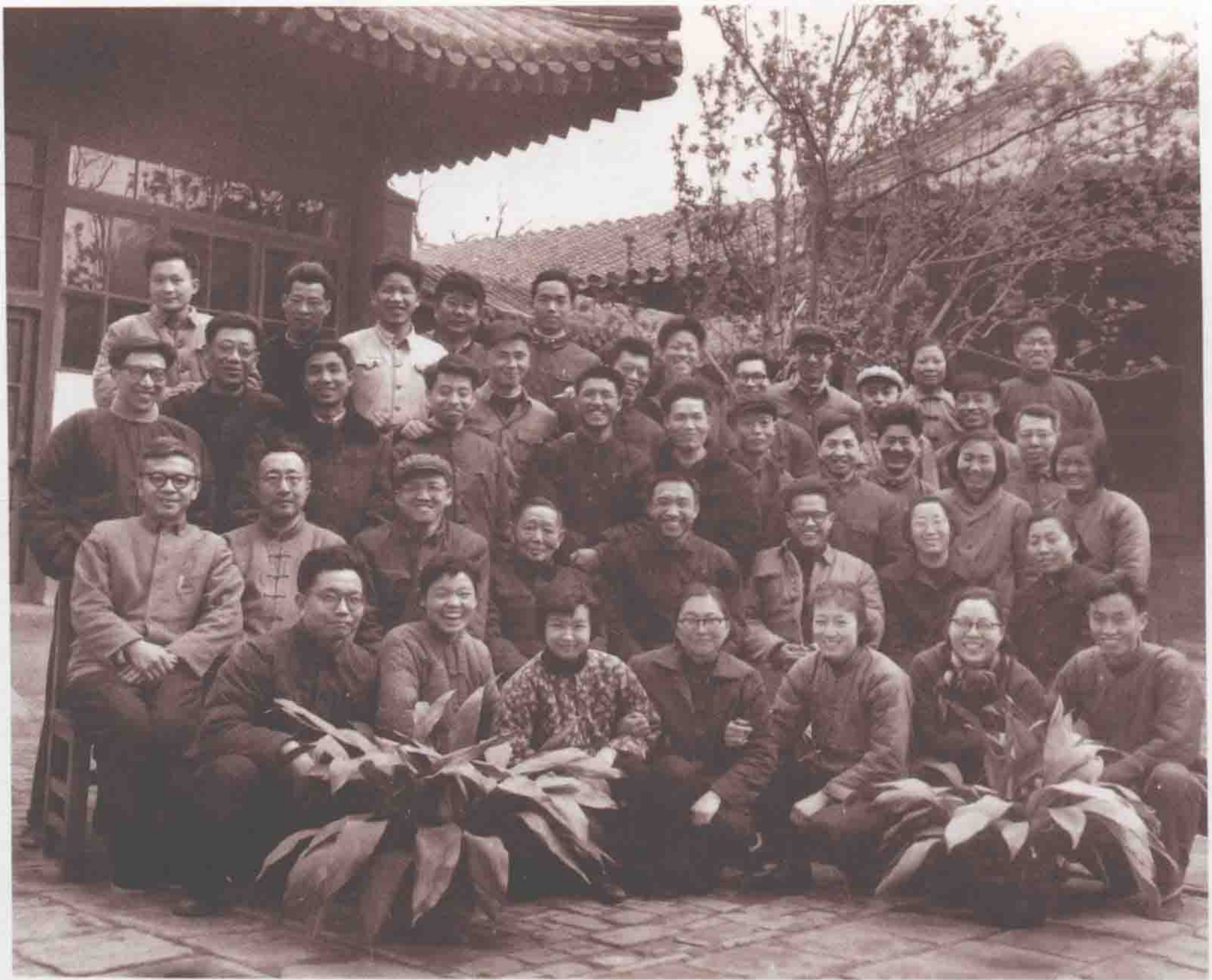
1966年4月全室职工合影