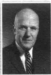
Neal E. Miller