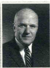
Neal E. Miller