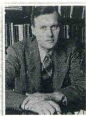
Robert R. Sears