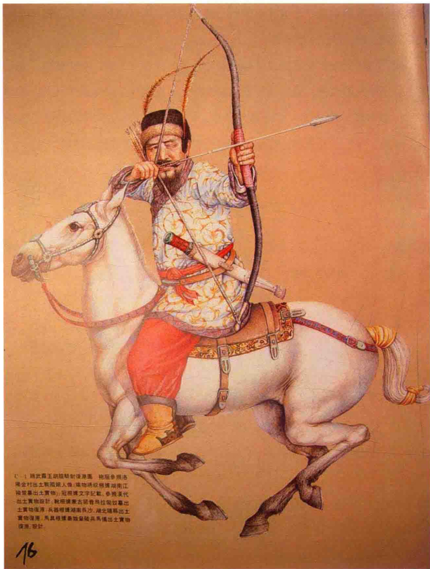
图1 赵武灵王胡服骑射像原图。袍履多采法 完全村出土彩陶人俑(器物博物馆湖南江 陵楚墓出土文物)。冠根据文字记载,参照汉代 出土文物设计。靴根据秦兵马俑拉弓姿势出 土文物复原。兵器根据湖南长沙、湖北随州出 土文物复原。马具根据秦始皇陵兵马俑出土文物 复原。设计。