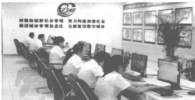
图 1-1 乌海市“12345”便民服务热线中心忙碌的工作现场

断完善,“12345”便民服务热线平台不断提升服务效能,开拓服务范围,现如今已经形成了规范、健全的“12345”工作模式。 ①