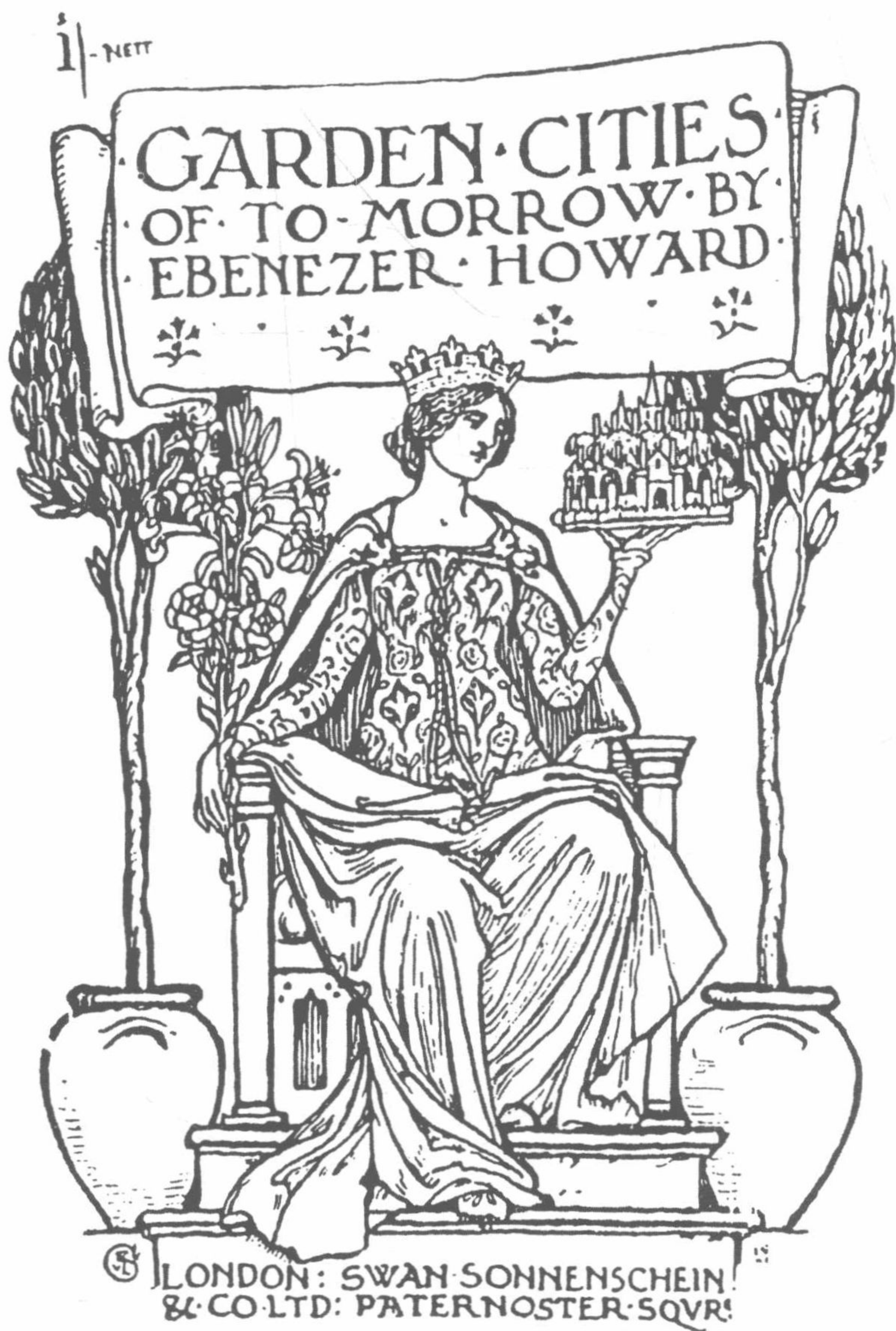
图2 沃尔特·克兰为《明日的田园城市》第二版设计的封面