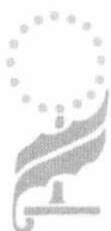
图1 《万能钥匙》封面草图