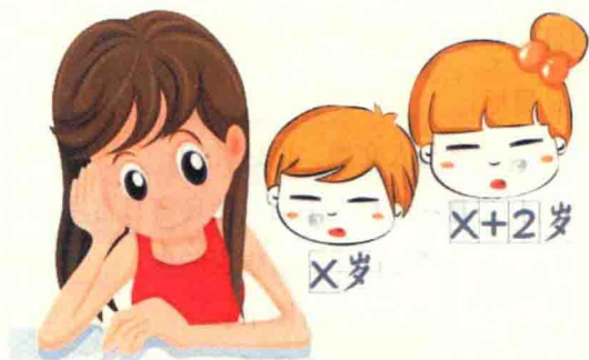
幼儿不同年龄语言发展目标

幼儿的语言学习需要相应的社会经验支持，应通过多种活动扩展幼儿的生活经验，丰富语言的内容，增强其理解和表达能力。应在生活情境和阅读活动中引导幼儿自然而然地产生对文字的兴趣，