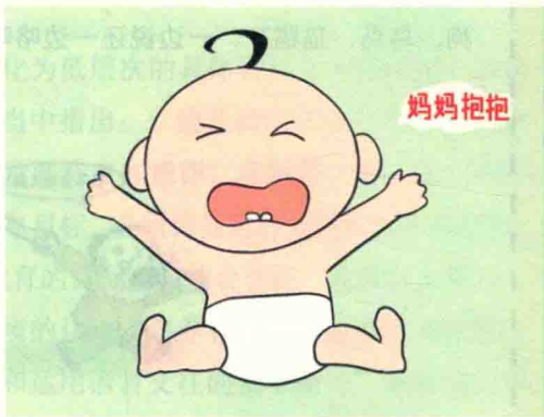
幼儿语言发展的特点

④复合句的特点。在陈述句中复合句使用比例较高；复合句多为联合复合句，其中，又以并列复合句为主，其次是连贯复合句和补充复合句；关联词的使用从无到有，正确使用率随年龄的增加而增加。如“因为我星期天去奶奶家了，所以没带来”。