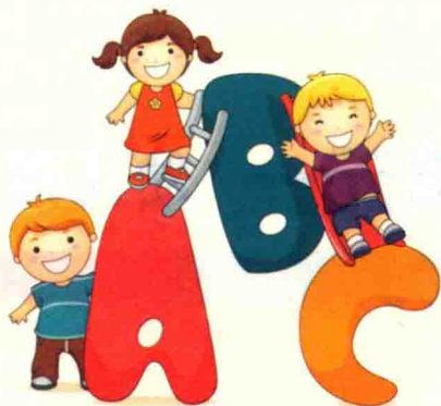
幼儿语言发展的特点

美国教育家霍华德·加德纳曾提出：人的智能包括七种，而语言交往能力是第一位，且语言发展是智力发育的基础。所以幼儿语言的发展是其心理和智力发展的重要前提。儿童发展心理学研究表明幼儿期（3～6岁）是语言发展的关键期。以下将主要从语音、词汇、句子等角度来阐述幼儿语言发展的规律。