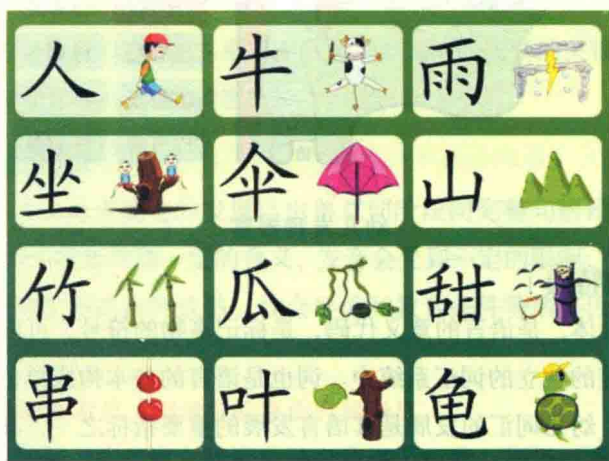
幼儿词汇发展的特点

等。所以幼儿对词汇类别的掌握与幼儿的认识水平、生活中接触频率、兴趣需要有很大关系，在词汇教育中家长和教师应注意到相关因素，从而有助于幼儿词汇的发展。例如在名词方面，在3~4岁时，可教授一些日常生活常见物体（玩具、家具、蔬菜、水果等），常见交通工具和动植物名称。在4~5岁时，可在幼儿掌握对物体的整体认识和名称的基础上，转入对事物各部分的认识，同时掌握各部分的名称。如衣服的领子、袖子，汽车的车头、车厢、车轮等。另外，还可以教幼儿掌握代表物体性质及物品材料的词，如有的衣服是棉布做的，有的衣服是化纤做的。在5~6岁时，在巩固已掌握词汇的基础上，大量增加幼儿掌握实词的数量，并提高质量，这一阶段幼儿思维开始出现抽象逻辑思维的萌芽，所以可教授一些概括性较高的名词，如家具、家电、交通工具、动物、水果等和一些有关自然现象的名词。