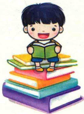
幼儿不同年龄语言发展目标