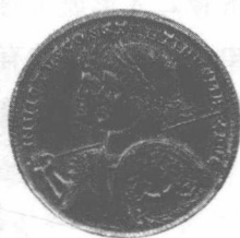
4世纪君士坦丁一世及其金币

重动荡的政治经济环境也使得社会各个阶层人人自危、朝不保夕、精神颓废、道德沦丧，宗教盛行，迷信活动遍及国中，怪异思想极端混乱。这场无法自救的大危机完全打乱了帝国经济、政治、文化、宗教等社会物质和精神生活的正常秩序，综合国力迅速下滑，军队分解，边关吃紧，无力抵抗来自境外的日耳曼诸民族入侵。因此，如何摆脱危机，尽快阻止帝国迅速衰亡的趋势，逐步走出危机造成的困境，这是当时历任皇帝面临的时代难题。