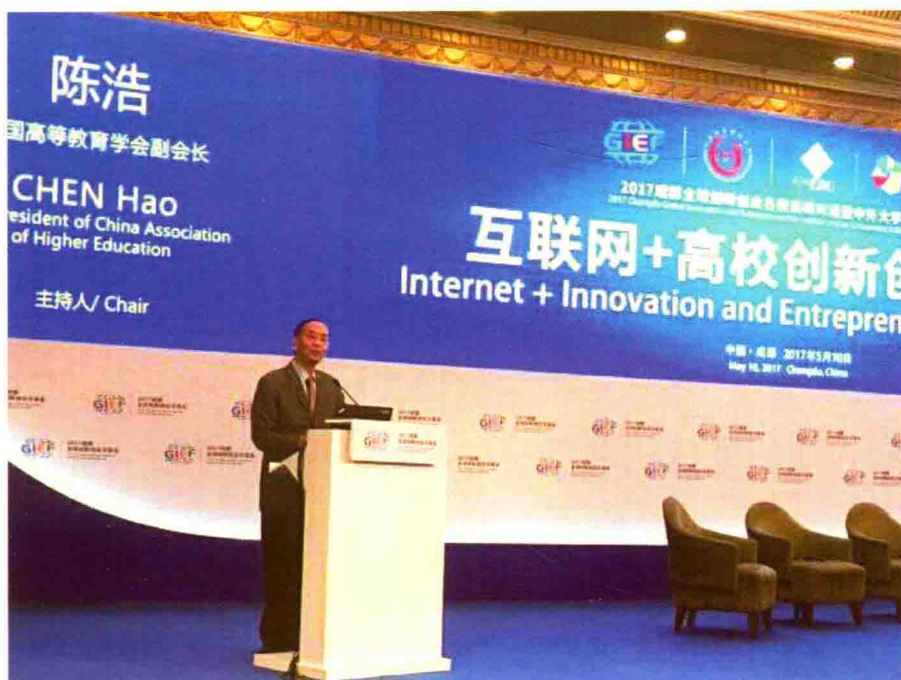
2017年5月10日，出席并分时段主持2017（成都）全球创新创业名校高峰论坛暨中外大学校长论坛。