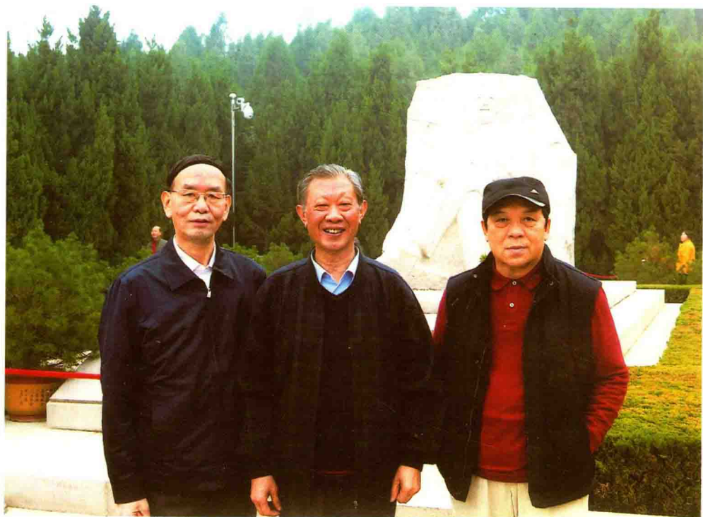
在西安督导教育部直属高校时，利用休息时间拜谒习仲勋同志陵园。