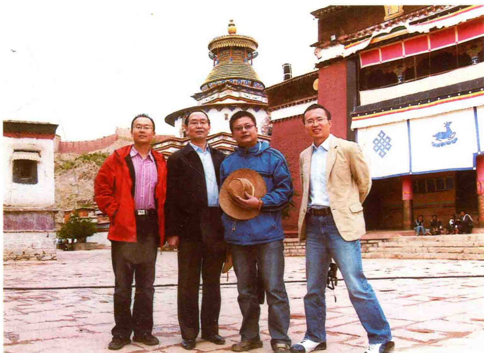
与《人民日报》、《光明日报》、《中国教育报》记者在西藏采访调研。