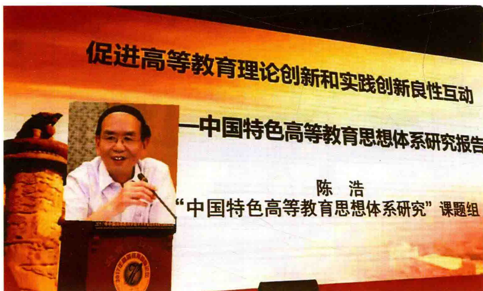
2017年7月4日，在中国高等教育学术年会暨高等教育论坛作主旨演讲，介绍有关研究成果。