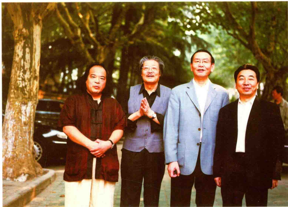
考察西安交通大学。