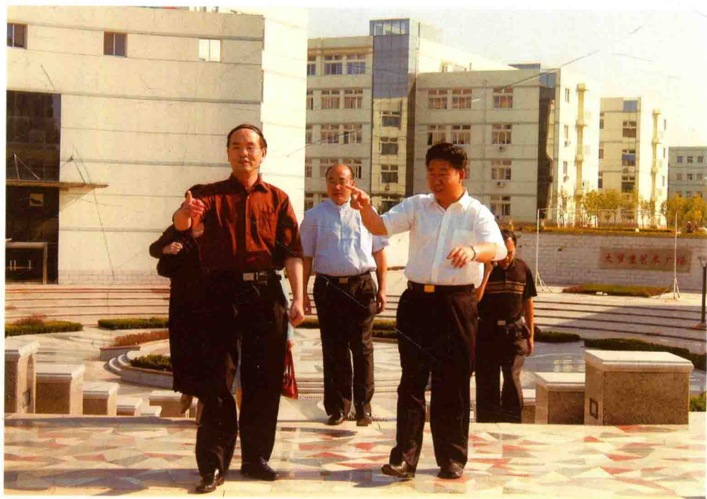
考察山东理工大学。