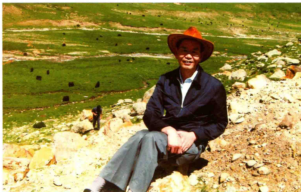
在考察西藏藏医学院藏药教学基地途中。