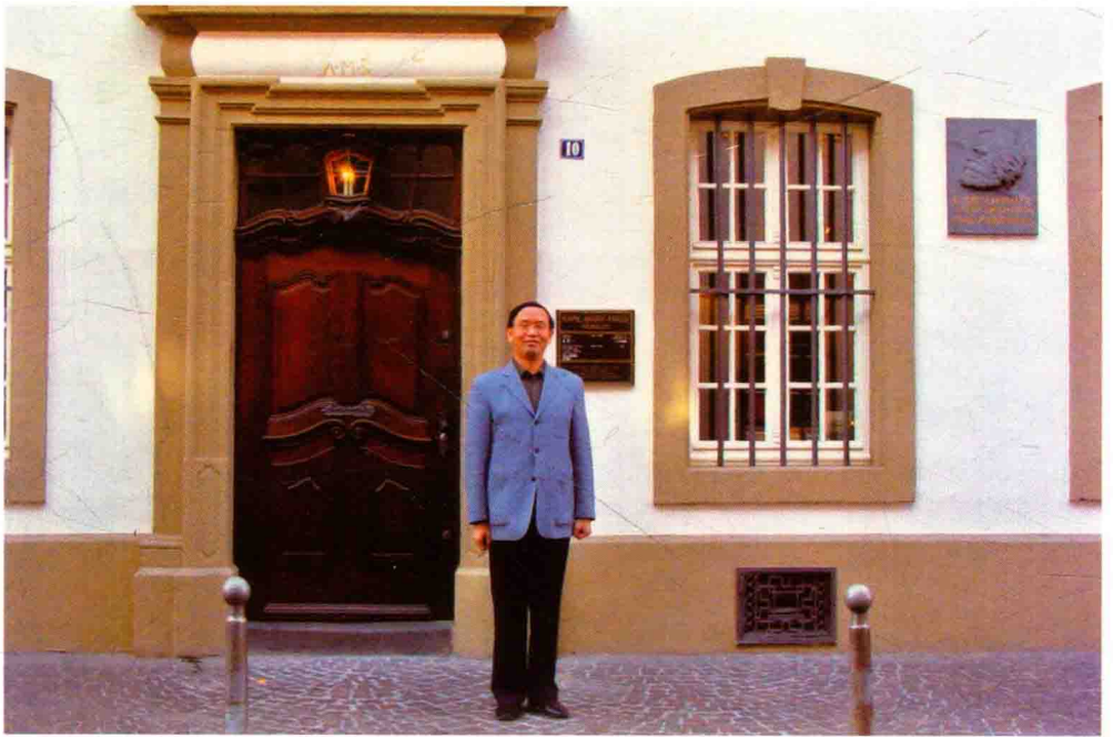
在德国特利尔瞻仰马克思故居。