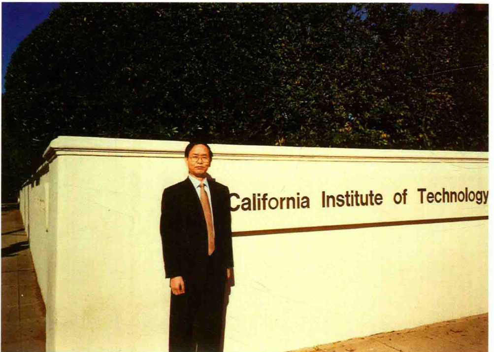
考察美国加州理工学院。