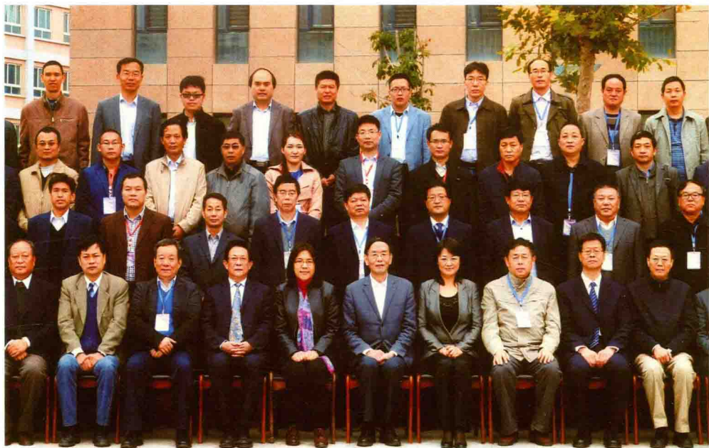
2014年10月15日，出席第三届西北联大与中国高等教育发展论坛，代表中国高教学会致辞，并发表《说大学之大，行大学正义》主旨演讲。