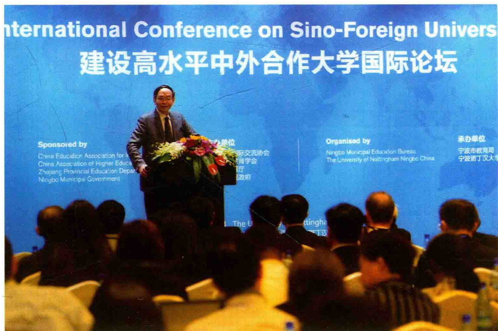
2014年10月18日，在宁波出席“建设高水平中外合作大学国际论坛”，并主持大会。