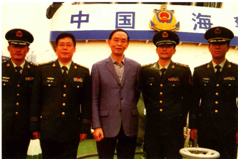
2016年4月7日，在地处宁波的海事警察学院讲学并登上该院海警实习船参观。