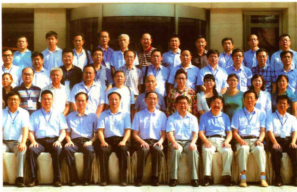
2013年8月3日，出席第二届西北联大与中国高等教育首发论坛暨纪念西北联大汉中办学75周年学术研讨会，代表中国高等教育学会致辞并发表以激发大学思想文化为主题的演讲。