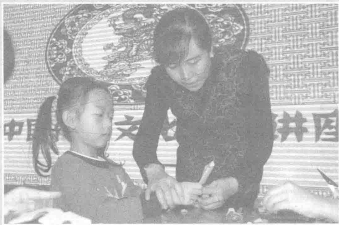
蓝天育翔幼儿园·剪纸讲座及教学活动