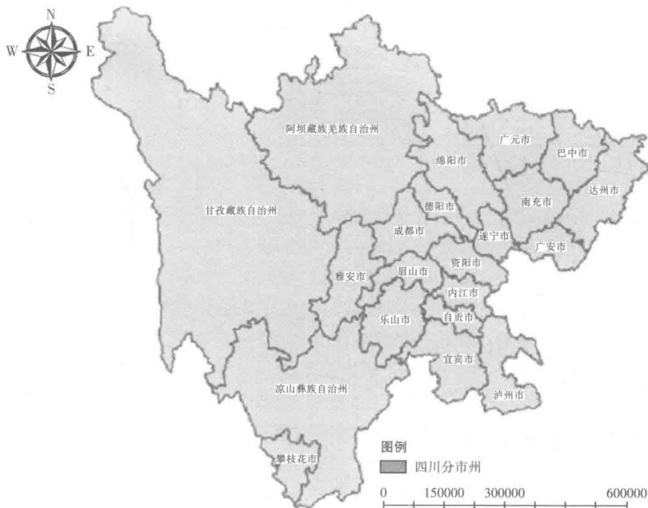
图 1-2 四川省行政区划