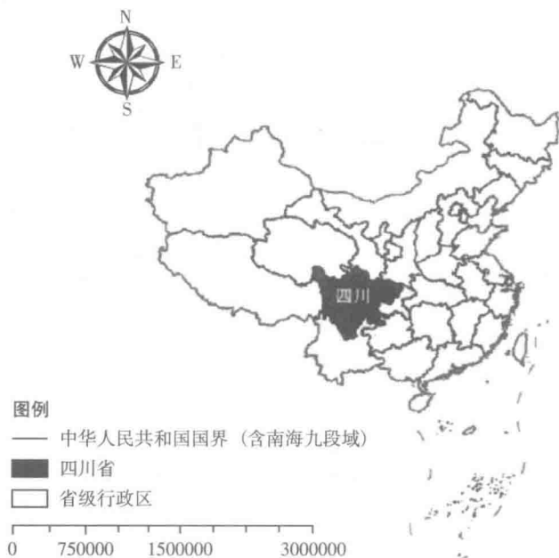
图 1-1 四川省在全国的位置