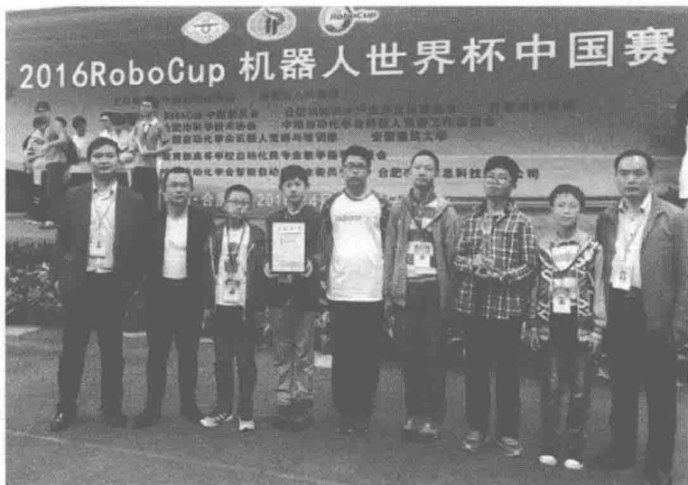
(2016年4月28日，在2016RoboCup机器人世界杯中国赛上，海门代表江苏省参加青少年组Mini救援项目，获得冠军奖杯。)

素质教育深入实施，各类竞赛捷报频传。大力实施素质教育提升工程、学生体质健康促进工程、中小学教育质量督导监测和校园足球改革三年行动计划。深入实施“作业革命”和体育百分百工程。成功举办了五届“珂缔缘”杯校园足球国际邀请赛，其中2017年“朗姿·珂缔缘”杯校园足球国际邀请赛暨“丝绸之路”U-14国际少儿足球赛，来自巴西、西班牙、澳大利亚、韩国、朝鲜、泰国、中国等7个国家的20支球队360余名球员参加了比赛。通过每年举办新教育艺术节、金钥匙科技节、球类俱乐部联赛、花样运动体育节，广泛开展学校社团活动，初步形成了“人人有项目、班班有团队、校校有特色”的生动发展局面。全市学校素质教育成果丰硕，体艺科技各类竞赛捷报频传。