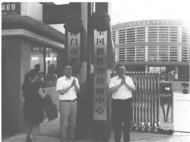
（朱永新教授和时任南通市市长张国华为全国新教育培训中心揭牌。图片由海门市教育局供稿）

9.3%提升到12.4%，一级教师3712人，占比由2011年的40.8%提升到45.01%。我们搭建教师成长平台，发挥名师辐射效应，创建了名师和名品项目工作室。到2017年，海门市级名师（名品项目）工作室由2011年的10个发展到30个，并建立了学科与集团工作室，各工作室已经成为优秀青年教师的集聚地和未来名师的孵化地。成立了中小学教师研修中心和新教育培训中心。教师研修中心成功创建为省示范性县级教师发展中心，六年合计举办383个培训项目，全员教师培训9.6万人次，专题培训1.5万人次，网络培训2.4万人次，为全市教师搭建了丰富的成长平台。新教育培训中心的活动也风生水起，享誉全国。每年为来自全国20多个省市自治区的万余名新教育实验区代表举办各类培训班；每年举办两次全国新教育实验海门开放周活动。仅2017年，新教育培训中心就为全国各地举办各类新教育实验培训34批次共2万余人次。