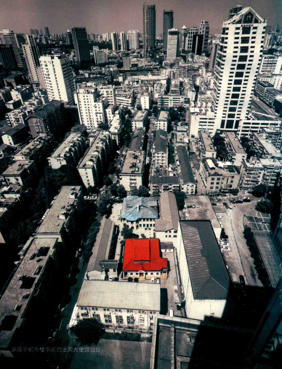
深藏于都市楼宇间的法国大使馆旧址