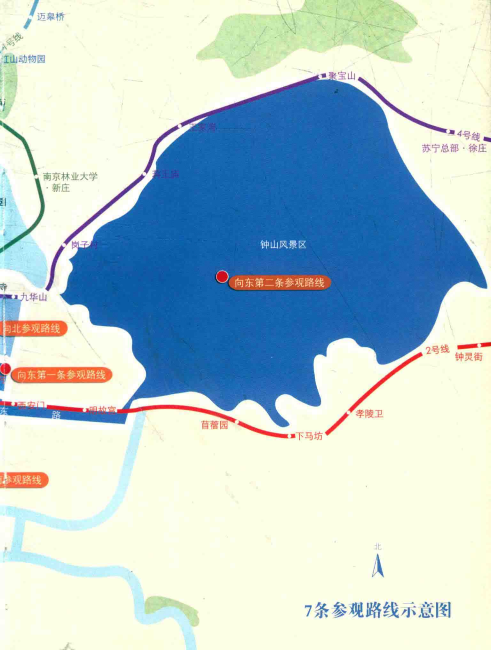
7条参观路线示意图