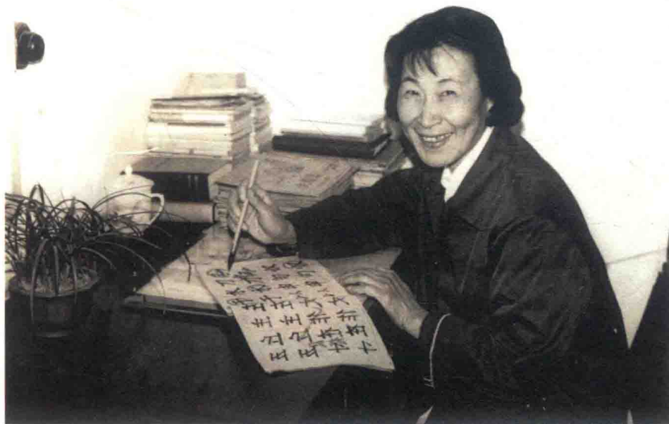
批改学生的写字作业