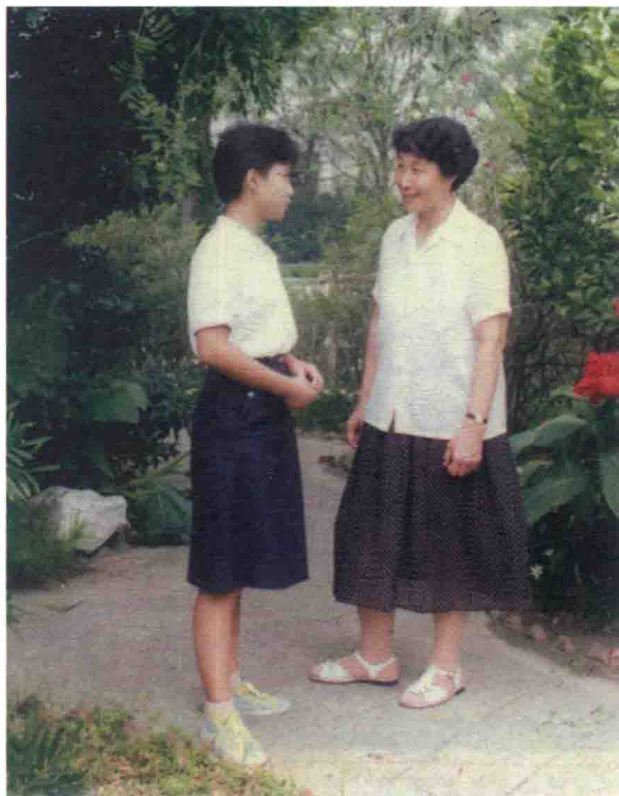
花径偶遇，也是师生交谈的好时机