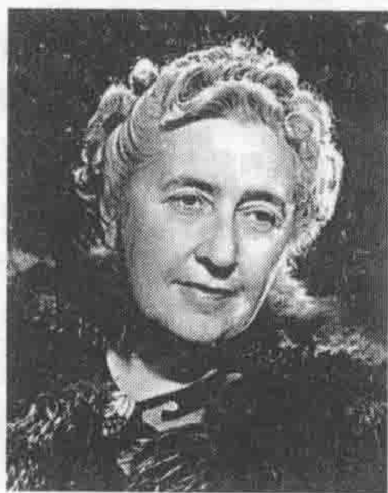
阿加莎·克里斯蒂 Agatha Christie (1890—1976)