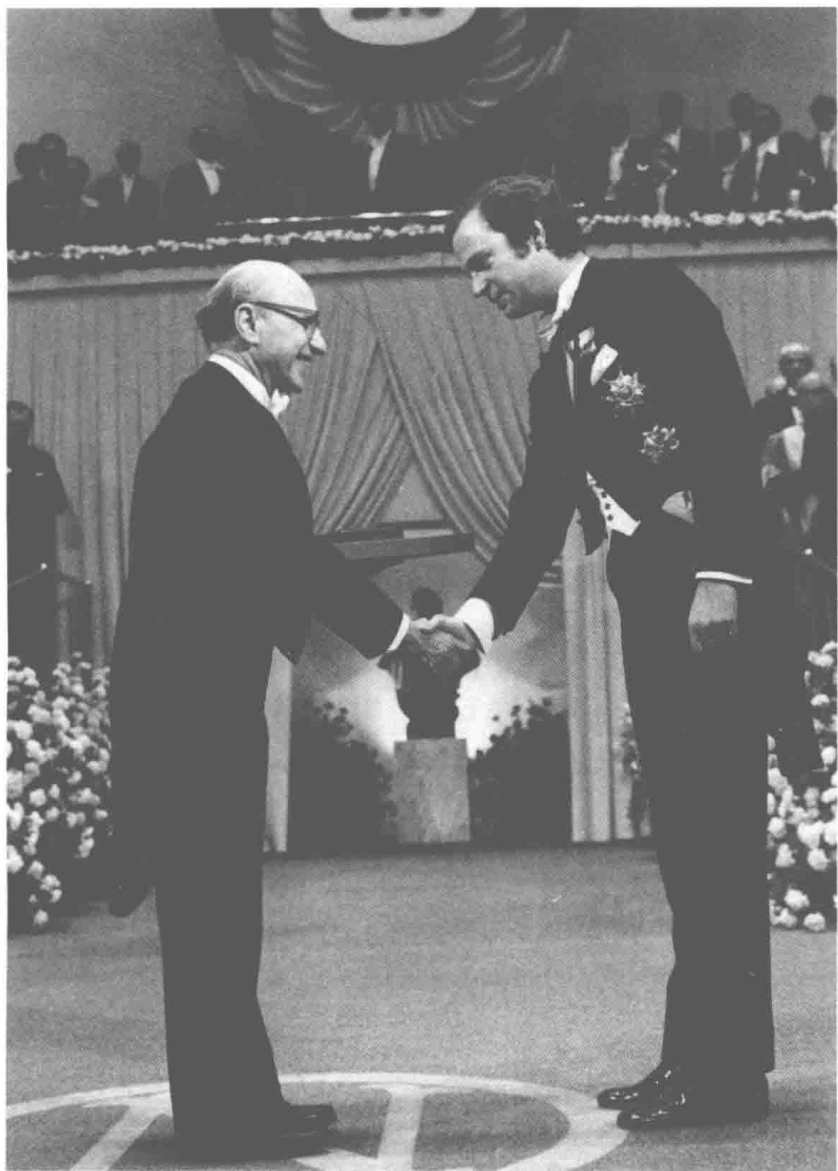
1976年12月10日，米尔顿·弗里德曼（Milton Friedman） 从瑞典国王卡尔十六世·古斯塔夫（Carl XVI Gustaf） 手中接过诺贝尔经济学奖