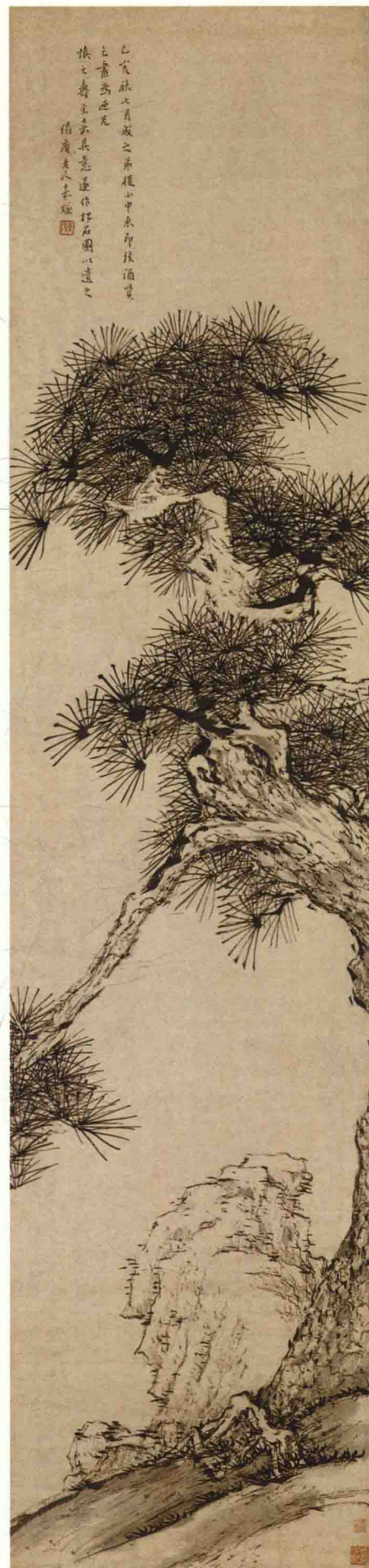
程嘉燧 松石图轴 明 纸本墨笔 纵130.3厘米 横30.4厘米 故宫博物院藏

《松石图》轴根据作者自题，画于明崇祯八年（1635），系为朋友祝寿之作。画面青松盘曲，苍茂秀逸。松针用中锋细笔逆锋勾描，细腻匀称。树下窠石用渴笔干墨勾皴，笔法疏放，构图高远。