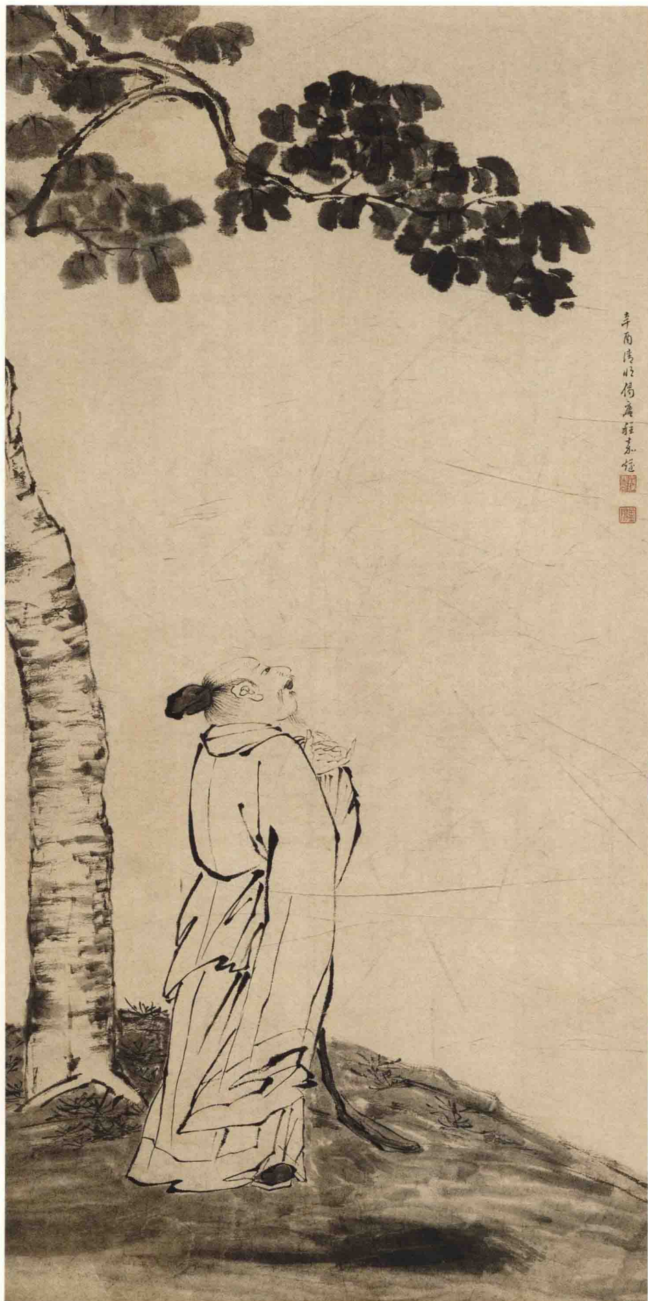
程嘉燧 桐下高吟图轴 明 纸本墨笔 纵116.4厘米 横28.1厘米 上海博物馆藏

梧桐树在文人眼中充溢着诗的灵性，它不仅可为琴瑟之材，亦是凤凰栖止之所。唐聂夷有句诗云：“须知澹泊听，声在无声中。”成了精神上的享受。同时，梧桐落叶最早，“梧桐一叶落，天下尽知秋”，也触发了诗人的感事伤时之情。此图所画，即是诗人于梧桐树下长吟之景。