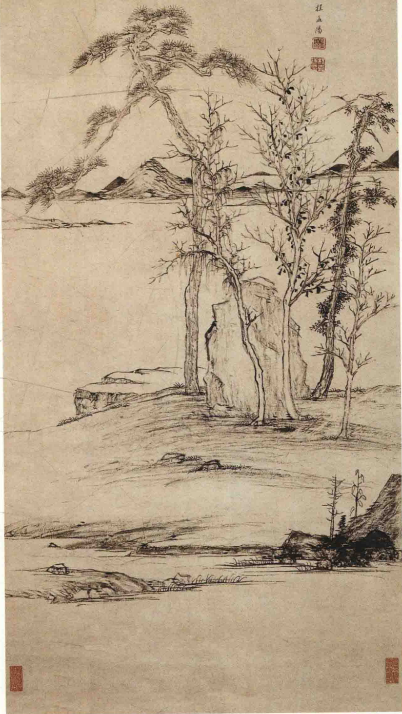
程嘉燧 霜林远岫图轴 明 纸本墨笔 纵101.5厘米 横45.6厘米 上海博物馆藏

《霜林远岫图》轴绘近坡丛树，掩映多姿；隔水远山，不作险势；人迹杳然，而生趣犹盛，一派倪云林的画境。