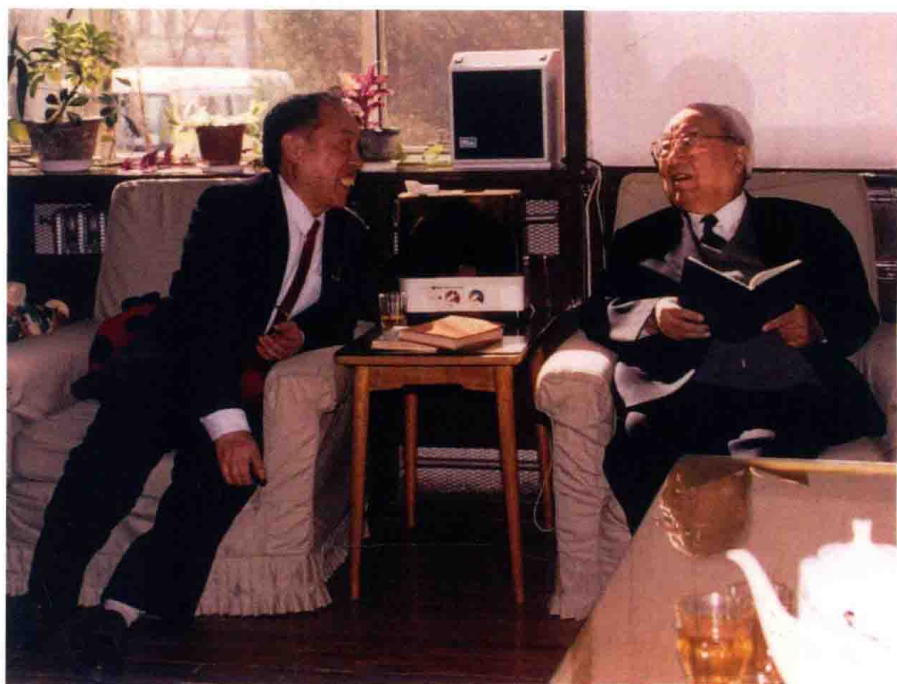
费孝通、陈连开先生在探讨中华民族多元一体格局的理论问题