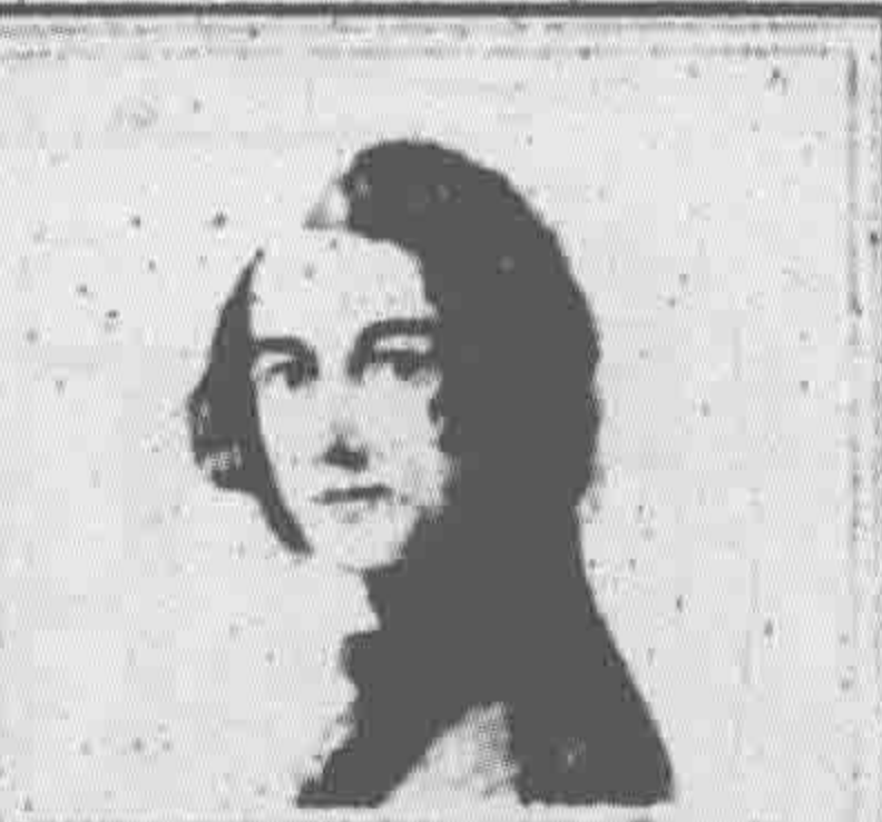
Charles Dickens in 1833