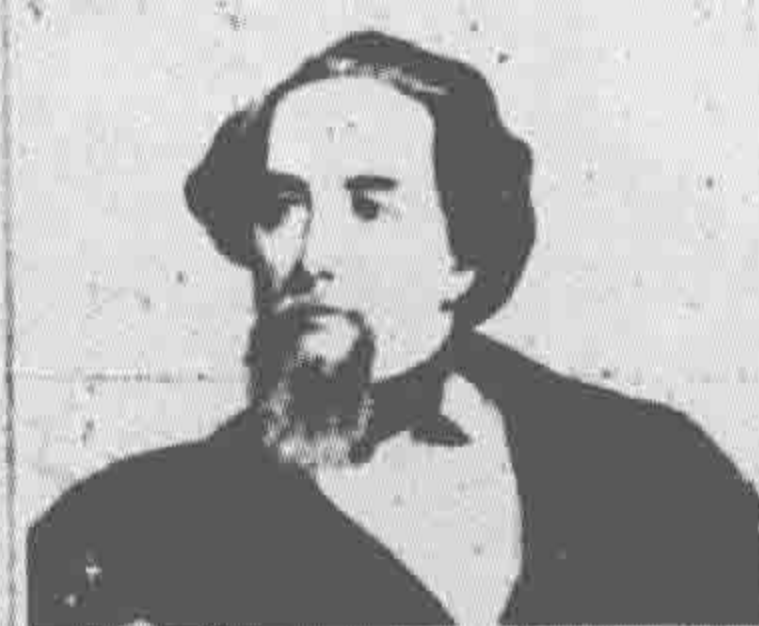
Charles Dickens in 1859