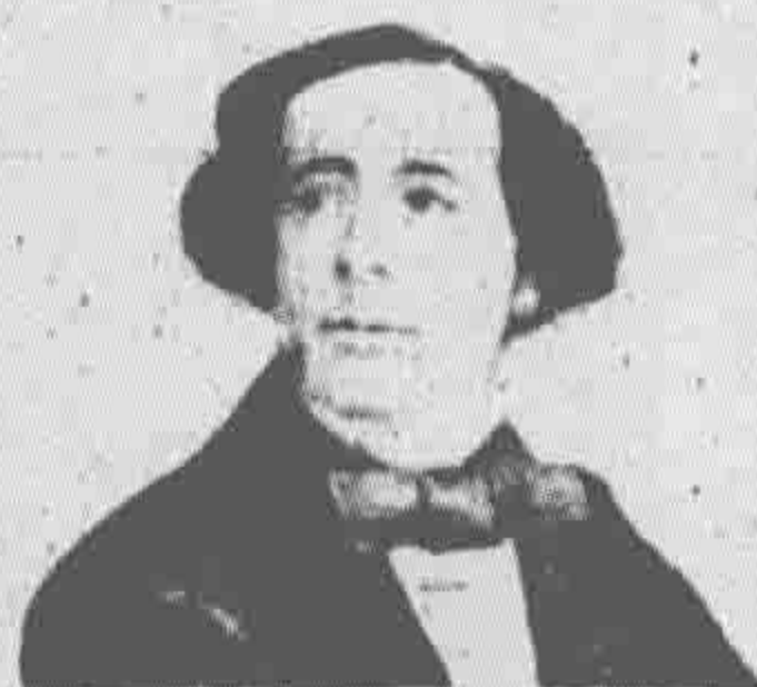
Charles Dickens in 1839