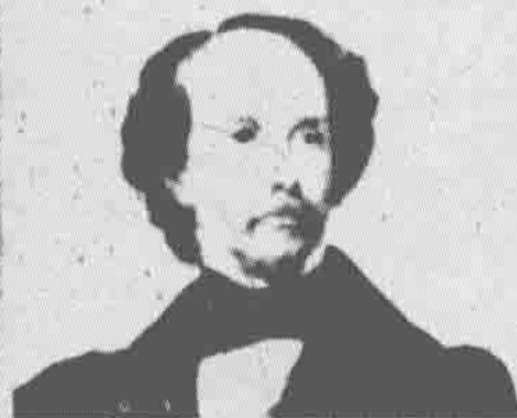
Charles Dickens in 1846