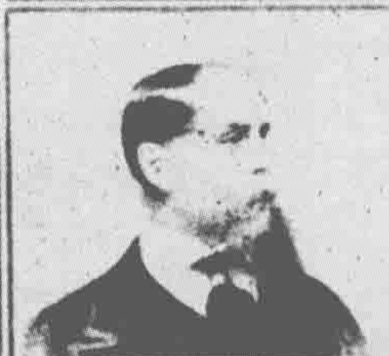
Charles Dickens in 1868