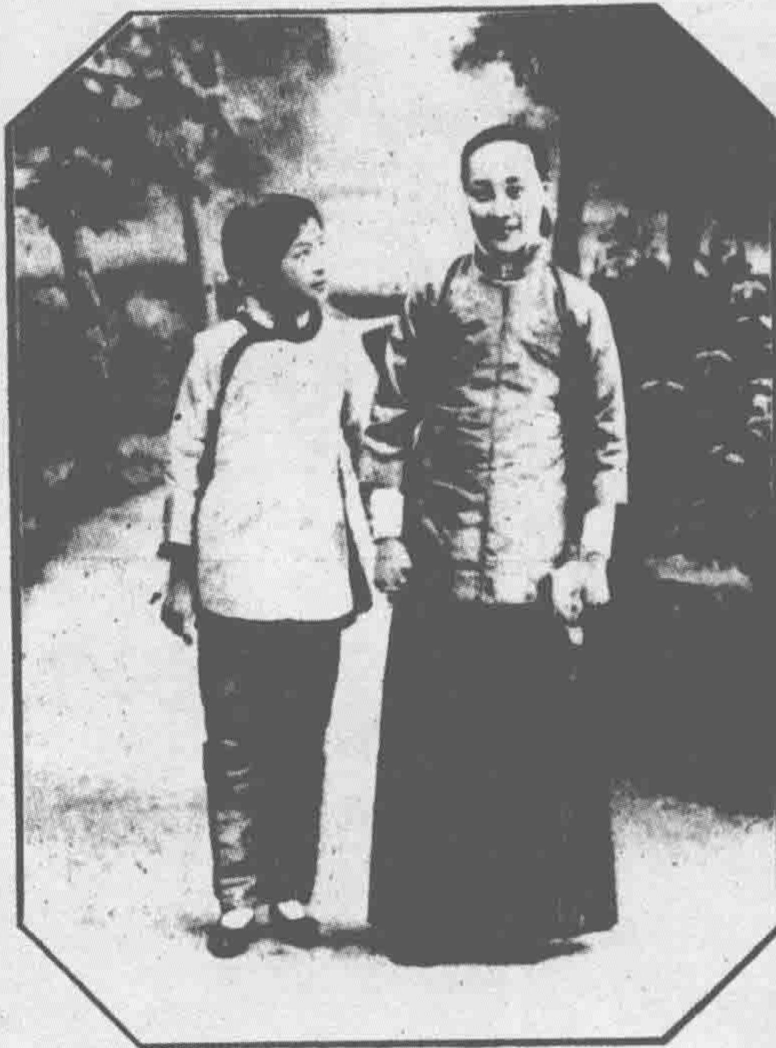
媚雲女士（天虛我生之夫人）