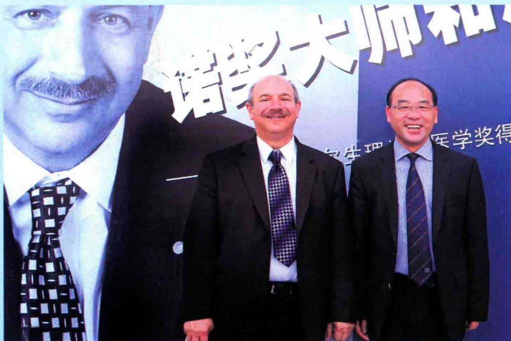
► 2015 年来茂德校长与诺贝尔生理学或医学奖获得者 Beutler 教授合影