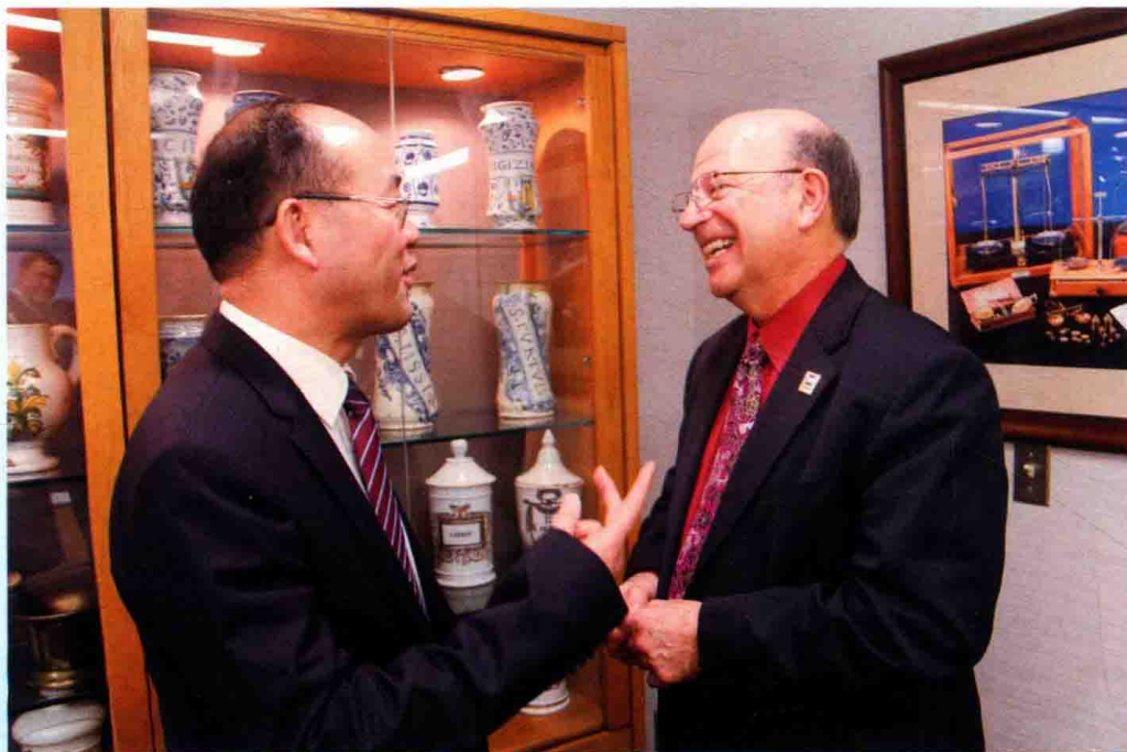
► 2014 年来茂德校长访问美国密歇根大学，与药学院院长交流并商定，启动合作培养药学博士