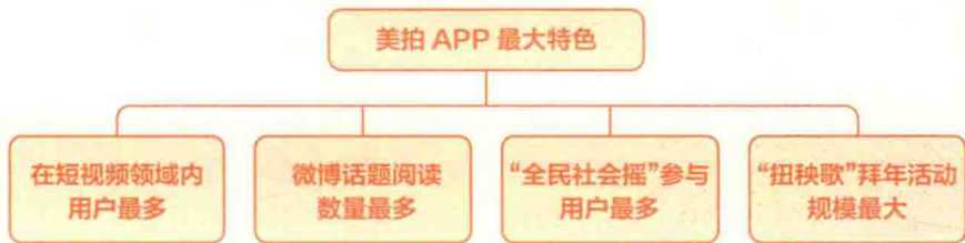
图 1-2 美拍 APP 最大特色

此外，美拍 APP 主打“美拍 + 短视频 + 直播 + 社区平台”。这是美拍 APP 的第二大特色，从视频开拍到分享，一条完整的生态链，足以使它为用户积蓄粉丝力量，再将其变成一种营销方式。