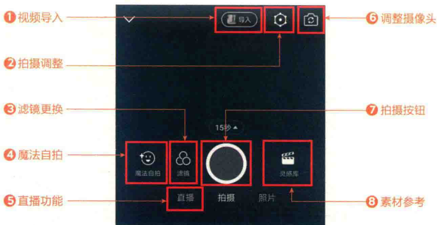
图 1-3 美拍 APP 主要功能用法页面展示