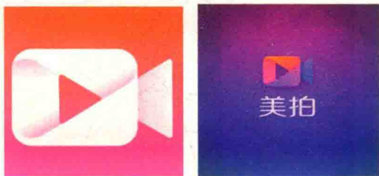
图 1-1 美拍 APP 封面及进入界面展示

美拍 APP 是一款由厦门美图网科技有限公司研制发布的集直播、手机视频拍摄和手机视频后期处理于一身的视频软件。美拍 APP 从 2014 年面世之后，就赢得了大众的狂热参与，可谓掀起了一场全民直播的热潮，算得上开启了短视频拍摄的大流行阶段。后经众多明星的使用与倾情推荐，使其真正深入人心，每当人们一想起短视频拍摄，总会想到美拍 APP，这款软件受欢迎的程度可见一斑，如图 1-1 所示为美拍 APP 封面及进入界面展示。