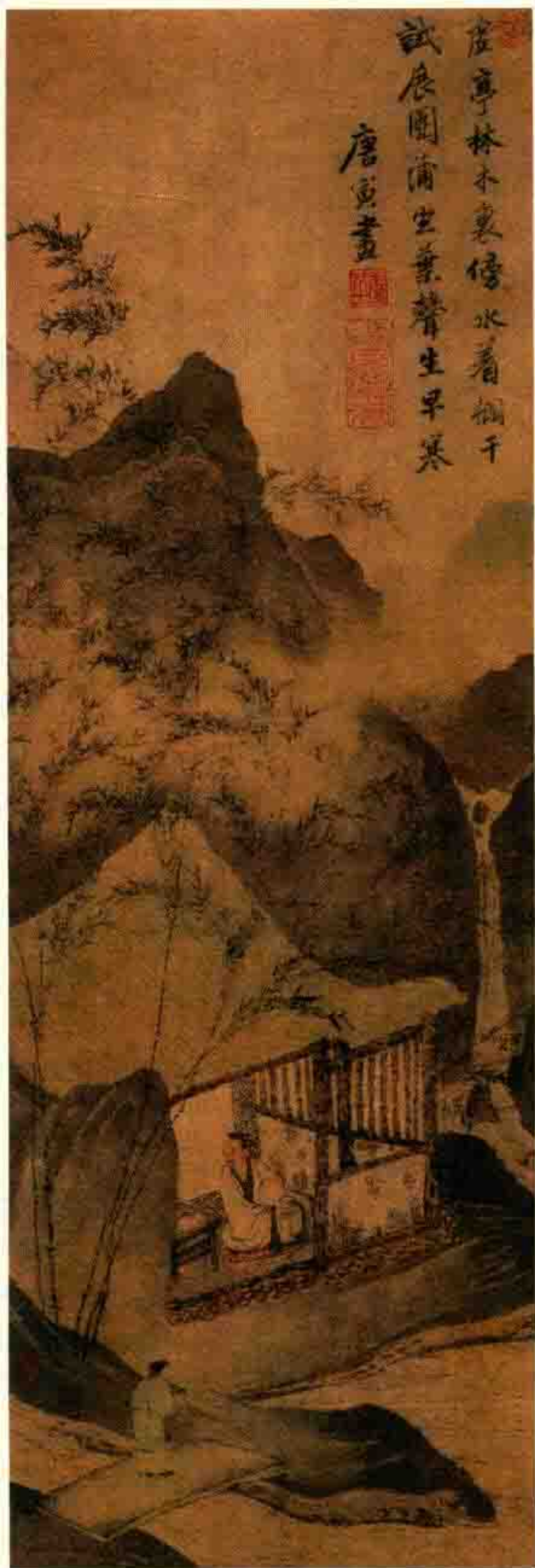
明·唐寅 草屋蒲团图