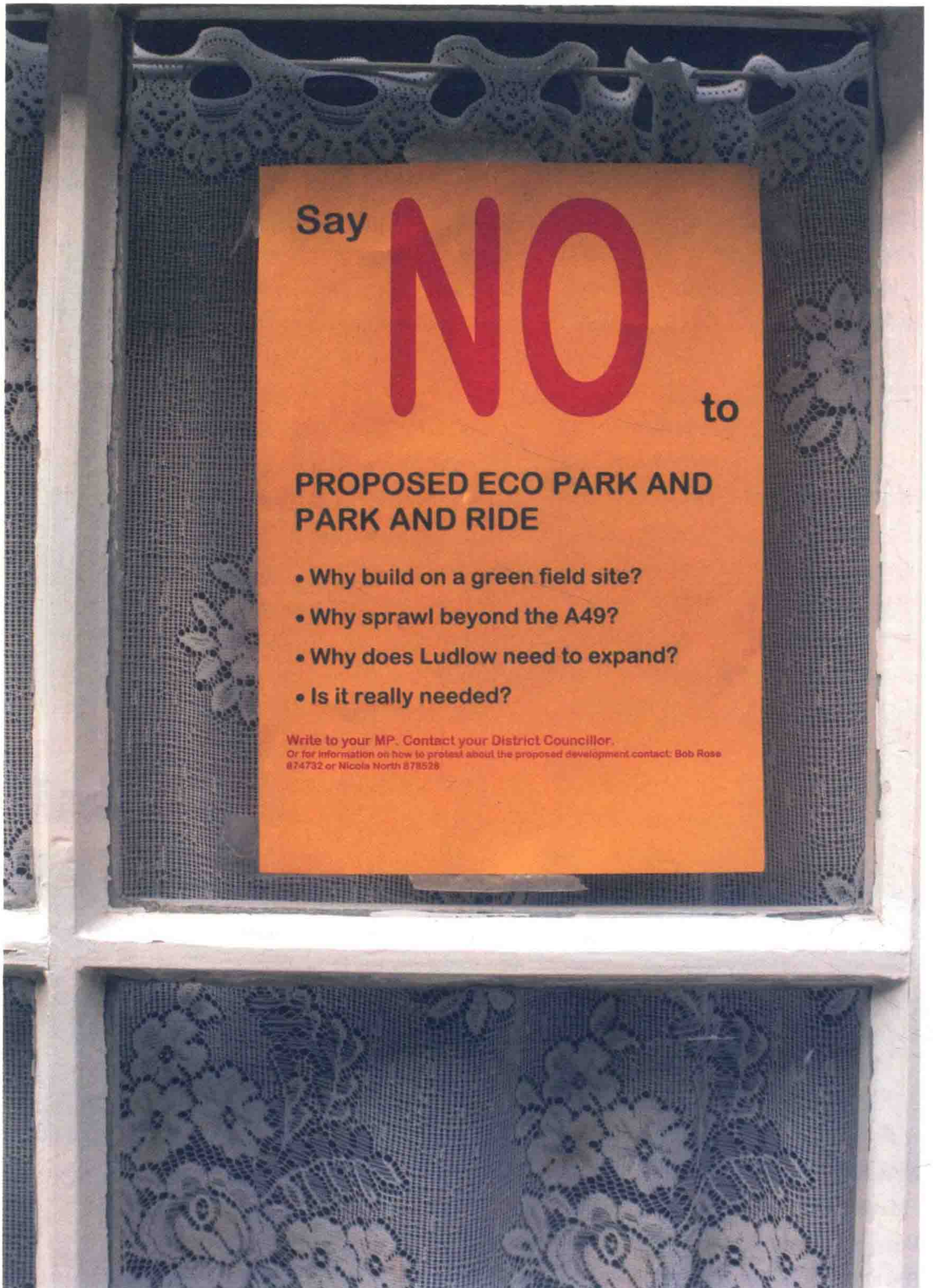
图 1 英格兰勒德洛 (Ludlow) 抗议海报