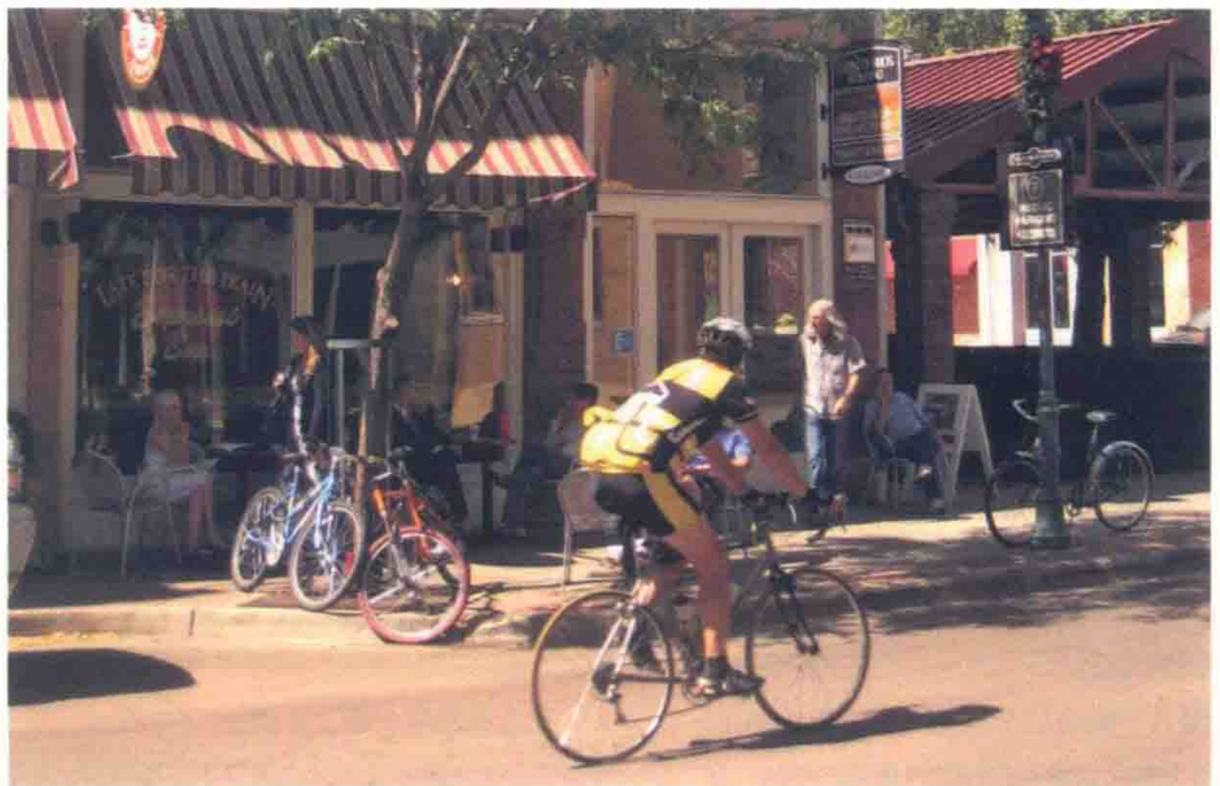
图 2 美国亚利桑那州弗拉戈斯塔夫 (Flagstaff)

弗拉戈斯塔夫曾经是伐木、矿业的中心，现在成为一个很繁荣的小镇。旧区修缮化了，外围都是新的开发。