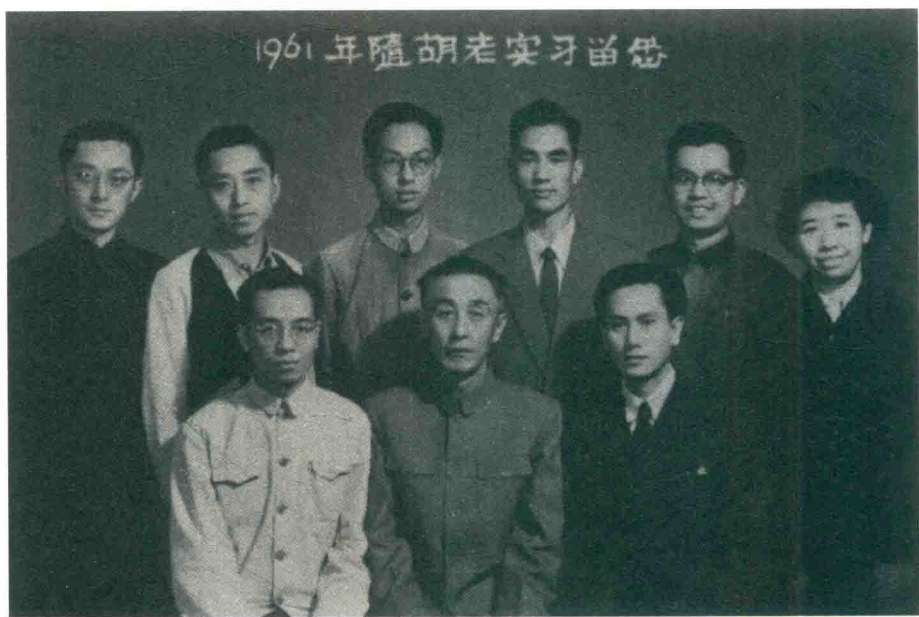
胡老与学生合影留念