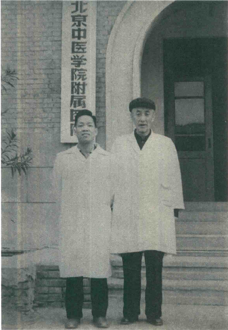
胡希恕先生与进修生合影