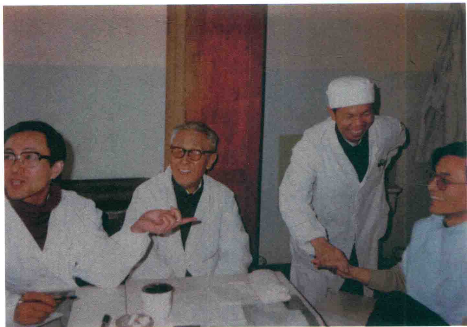
胡老与日本留学生座谈