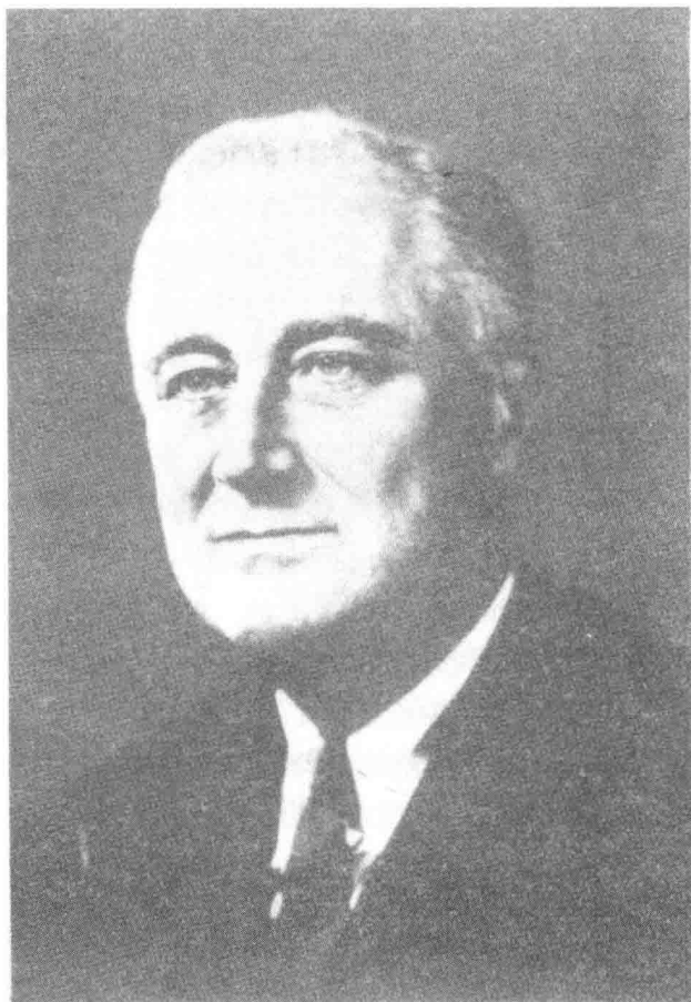
富兰克林·德·罗斯福