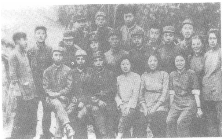
1941年12月，新四军六师教导大队指战员由苏南抵达江高宝后合影。