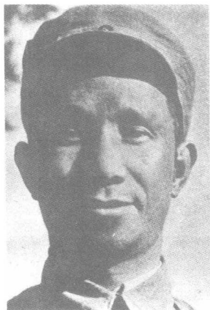
华中军区副司令员 华中野战军司令员 粟裕