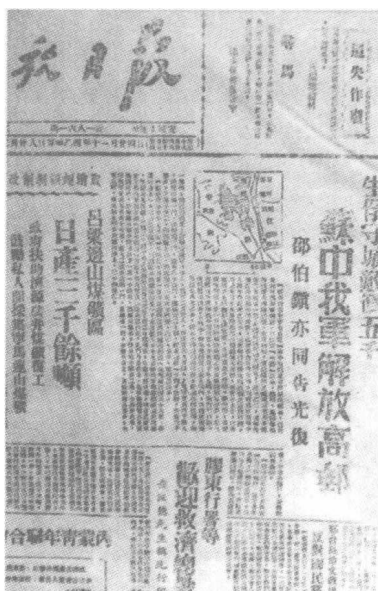
1945年12月 28日《解放日报》 关于高邮大捷的 报道