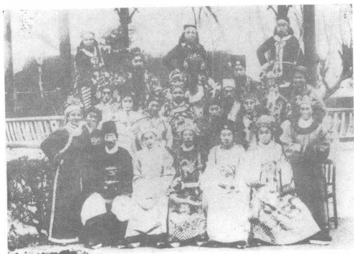
1946年1月，华中二分区前哨剧团演出京剧《九宫山》时合影于高邮城。