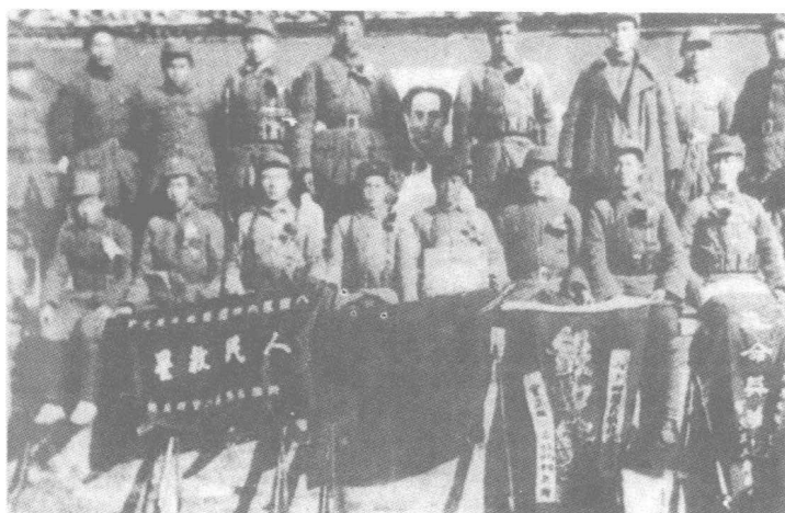
高邮战役中涌现出的战斗英雄和模范工作者