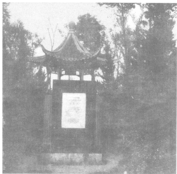
中共界首乡师支部纪念碑