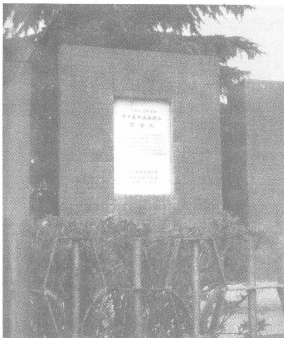
中共高邮县委建立纪念碑