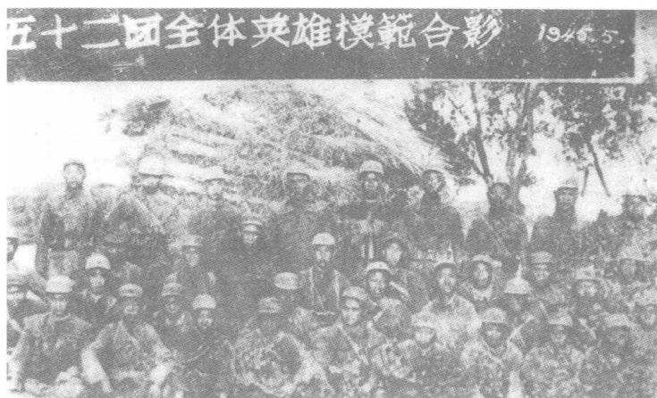
· 五十二团三垛河口伏击战全体英模合影