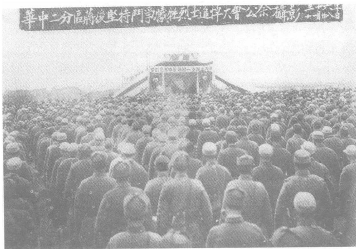
1947年11月28日，中共华中二地委、苏皖二专署召开公祭大会，悼念在坚持敌后斗争中牺牲的烈士。