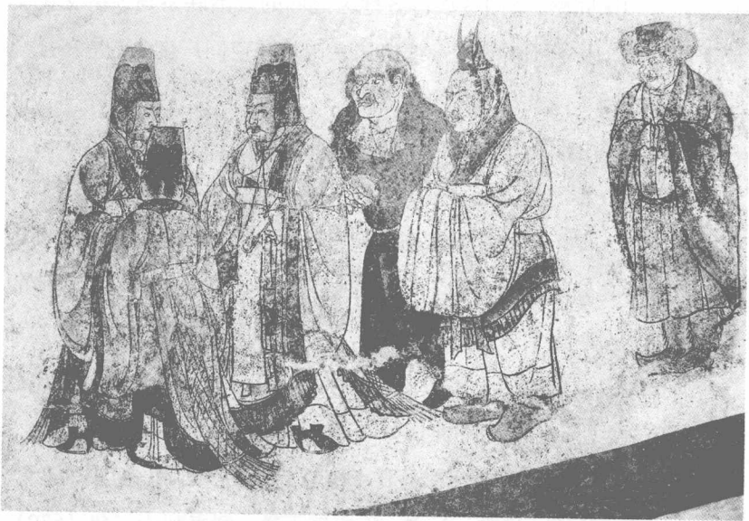
图4 陕西乾县唐代章怀太子墓壁画《客使图》

全国共有358个州府，1551个县。贞观二十年（646），唐朝出兵漠北蒙古高原，在九姓铁勒诸族的配合下消灭了北方的薛延陀汗国，并于次年在薛延陀故地设立了羁縻性质的六府七州。至此，唐朝的疆域东极大海，西至焉耆，南尽唐林州南境（今越南中部），北到薛延陀境内，超过了隋朝的疆域。到8世纪中叶的盛唐开元、天宝之际，州县数与贞观时期基本相同，但羁縻州县不计算在内。开元二十一年（733），唐朝在贞观十道的基础上将山南道、江南道各分为东、西两道，又增置黔中道及京畿（长安）道、都畿（洛阳）道，共十五道，每道派采访使监察；又在沿边地区设安西、北庭、河西、朔方、河东、范阳、平卢、陇右、剑南、岭南五府等十道节度、经略使。盛唐时的疆域比唐初更大，东至安东府（曾治今朝鲜平壤），西至安西府（治今新疆库车），南至日南郡（治今越南清化），北至安北府（曾治今蒙古