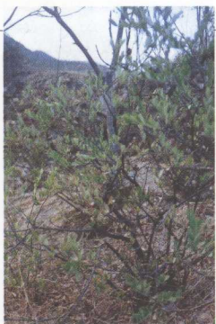
制造白地纸的原料—— 瑞香科菟花