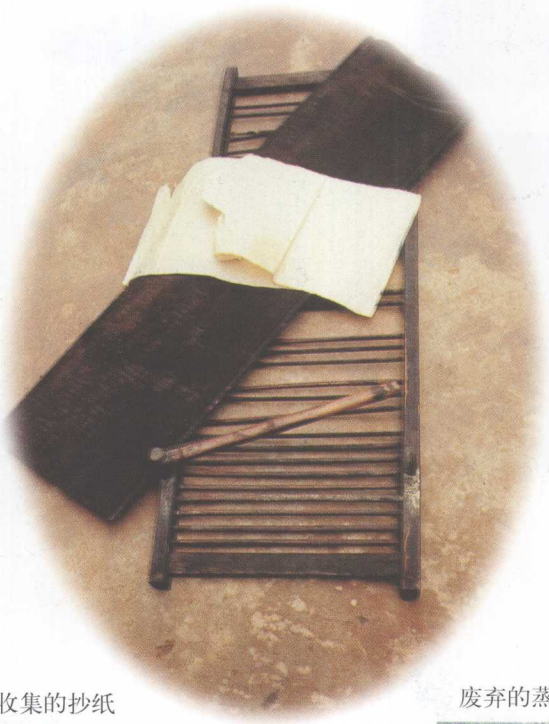
笔者收集的抄纸帘及所抄的纸