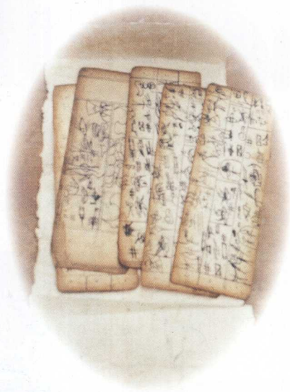
笔者收藏的白地纸及东巴经