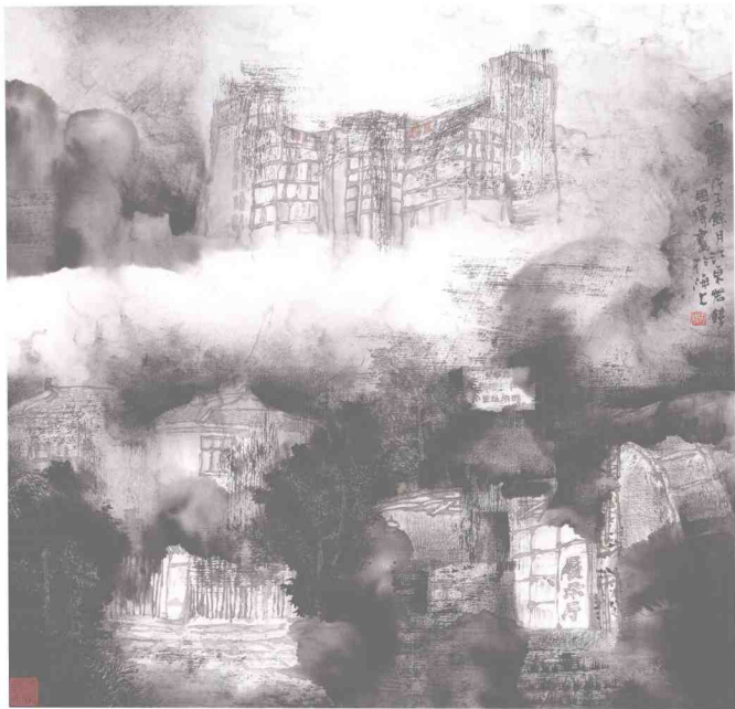
风韵描绘系列·会员作品