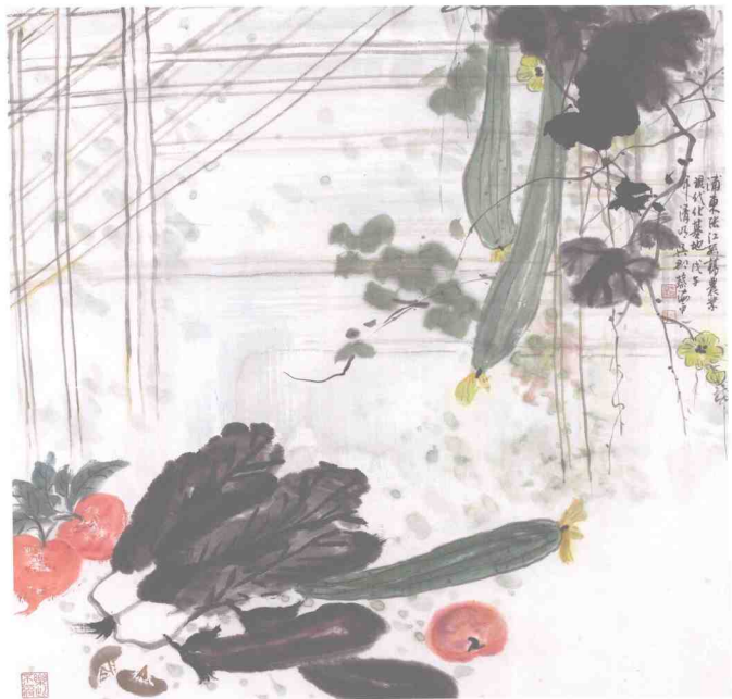
风韵描绘系列·会员作品 浦东张江孙桥农业现代化基地 上海美协海墨画会 蔡海平